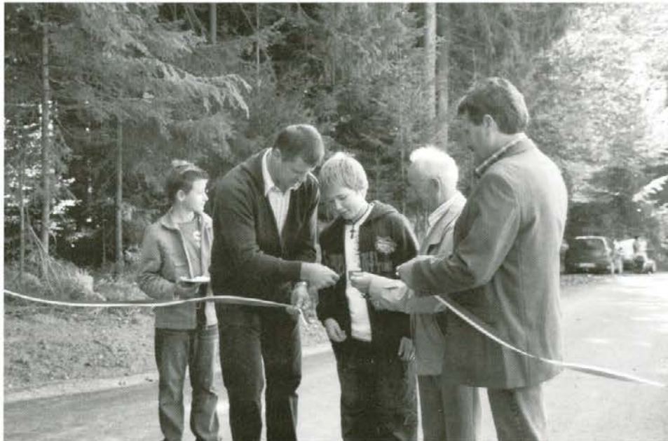
Trak je prerezal Pernatov sin

Dostojno in zares slovesno so se pripravili na ta dogodek. Sleherni obiskovalec, domačin ali slučajni »mimohodec«, je dobil kozarček dobrega. Na ražnju so vrteli ovčko, bilo je veliko drugih dobrot, manjkalo ni niti pravega domačega mošta in dobre volje. Najslavnejši trenutek rezanja traku so prepustili dvema domačima fantičema, saj je mladim in