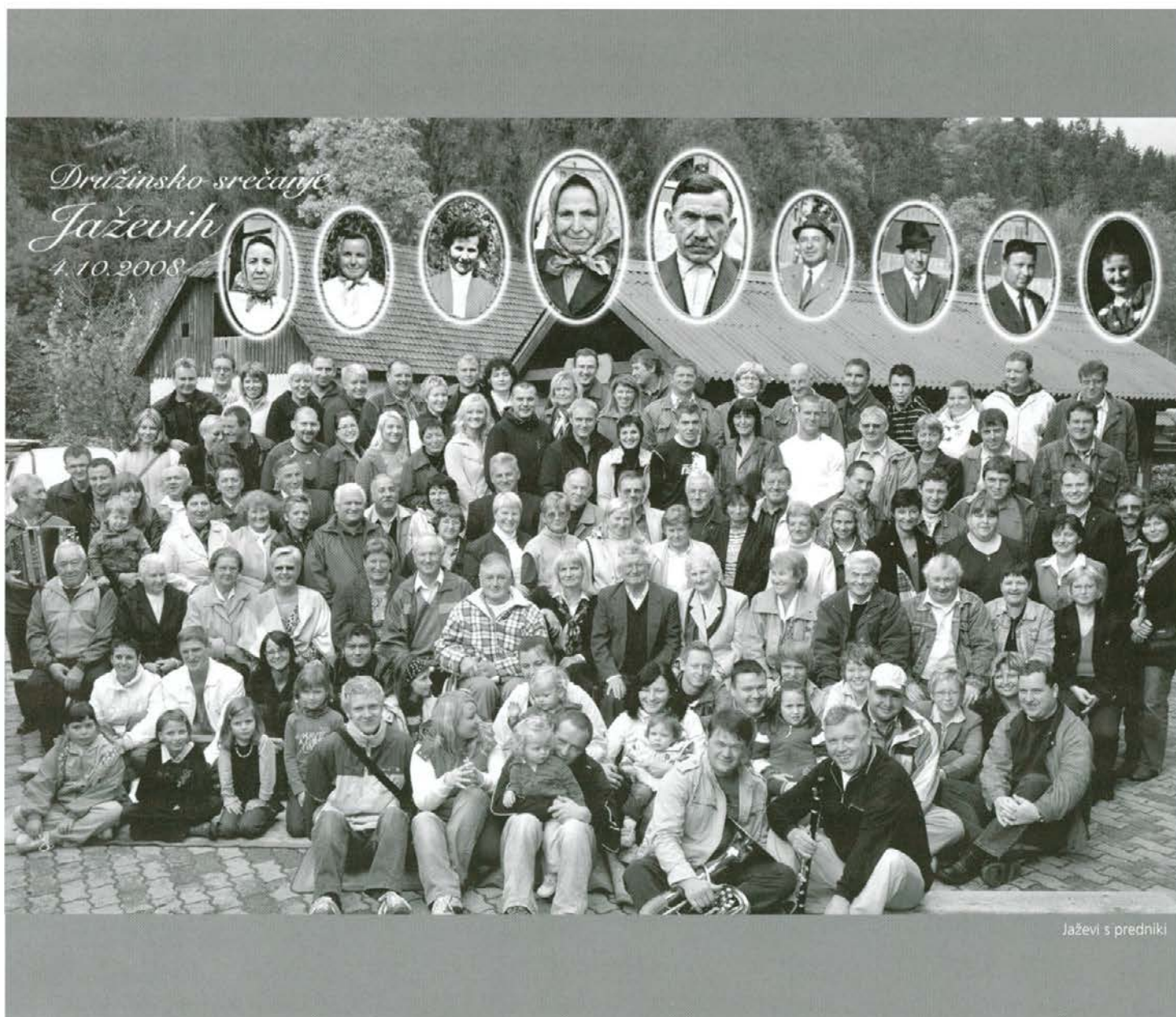
Jaževi s predniki

Na srečanju se nas je res zbralo veliko Jaževih. Iz ožjega rodbinskega kroga jih je manjkalo le nekaj, ki se pač iz kakšnega upravičenega razloga srečanja niso mogli udeležiti. Vsi pa smo si zagotavljali, da se zagotovo še snidemo, morda celo v večjem številu.