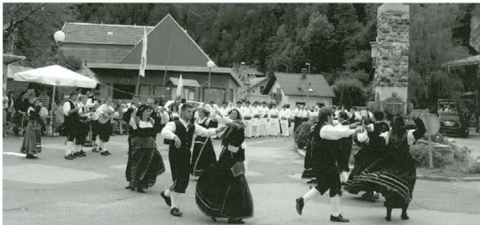
Na Koroški gaudi je zaplesala folklorna skupina Le Gemme dedel Matese iz San Masima (Italija)