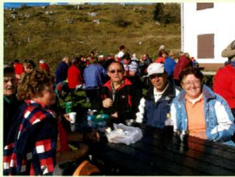
Lepo vreme je na Goro privabilo številne pohodnike

Srečanje na Uršlji gori pa marsikomu pomeni ne le sprostitve po ne preveč naporni poti, pač pa tudi lepo priložnost, da se sreča s svojimi prijatelji in znanci. Na dan svete Uršule je v njeni cerkvi, ki je najvišje ležeča cerkev na slovenskem, tudi daritev svete maše, kjer v samem obredu sodeluje veliko število vernikov in duhovnikov. Letos je bila cerkev med