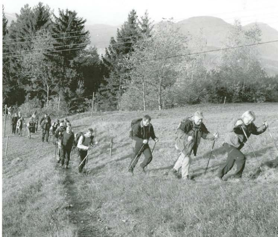
Kolona pohodnikov na poti