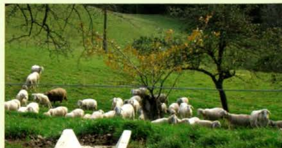
Ovce imajo izdelan izhod iz hleva tako, da se lahko poljubno vračajo vanj

Na njivah pridelujejo tudi sojo, približno 50 kg so je pridelali letos, iz nje pa delajo sojino mleko, namaze in sojin sir. Na njivah sejejo tudi vsa krušna žita, razen tritikale, ki jim ni uspevala, pa tudi ajdo. Gospodar pravi, da ko je živel še njegov oče, so sejali tudi lan, in so ga imeli za obleko in posteljnino in prte. Gospodar je povedal, da je bila uvedba umetnih gnojil usodna za njegovega očeta, saj se je zastropil s »Thomasovo žlindro«. Od tistega časa niso več uporabljali umetnih gnojil.