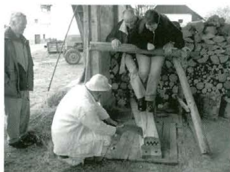
Prikaz trenja lanu