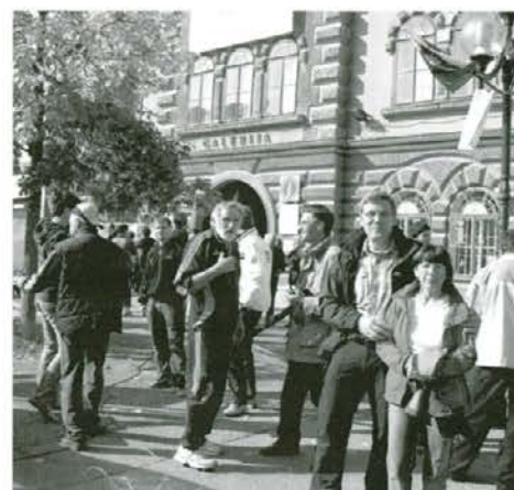
Tudi na Glavnem trgu, kjer je bil start Teke miru, je bilo živahno