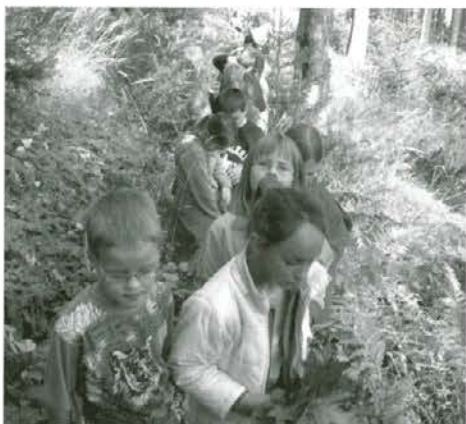
Tretješolci OŠ Prežihovega Vrancea na GUP Navrški vrh