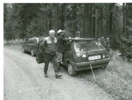
Obdelava podatkov na terenu (semenski sestoj evropskega macesna Šteknija - Tolsti vrh)

Vse bolj pogoste klimatske spremembe vplivajo tudi na naselitev novih gliv in žuželk v našem okolju. Med podlubniki je v Sloveniji zelo maloštevilno prostorsko zastopan mali osmerozobi smrekov lubadar ( Ips amitinus ), ki se najraje zavrtja pod lubje smrek in rdečega bora. Najraje živi v višjih predelih (nad nadmorsko višino 1000 m). Prvo nahajališče do sedaj