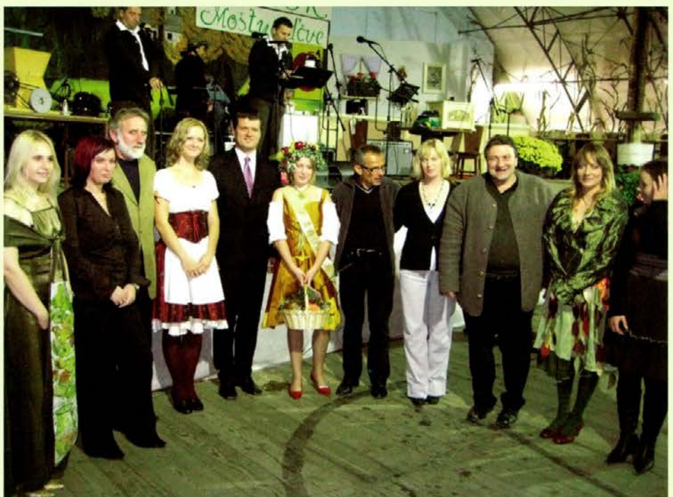
Koroški župani med novoizvoljeno in prejšnjimi moštnimi d'čvami