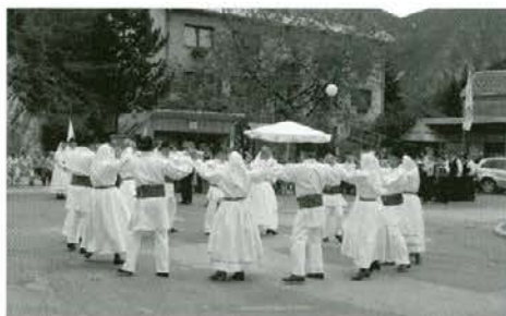
FS ŽKUD Tine Rožanc iz Ljubljane se je na Koroški gaudi v Črni na Koroškem zavrtela po belokrajnsko

Z mednarodno folklorno prireditvijo »Koroška gauda« se je zaključil 53. turistični teden v Črni na Koroškem. Hvala vsem, ki ste finančno ali kako drugače pomagali, da je kulturna prireditev uspela. Ta prireditev se je zelo dobro prijela in je med najbolj obiskanimi prireditvami Turističnega tedna v Črni na Koroškem.