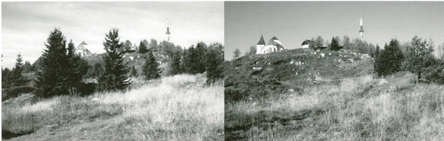
Zaraščene površine Očiščene površine

zaraščajočih površin na mislinjskem delu Pohorja. V bodoče je potrebno preprečiti zaraščanje tudi na preostalem delu Pohorja, na Smrekovcu in Peci, kjer so do sedaj v okviru svojih zmožnosti ta dela opravljali le lovci. Najverjetneje pa bo obsežnost zaraščanja na Peci zahtevala širši pristop v smislu evropskega projekta.