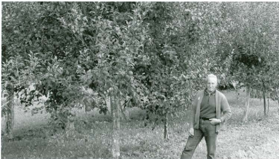
Ta jablana je dala 8 zabojev po 15 kg namiznega sadja

Čeprav nisem več mlad, sem srečen, ko se sprehajam po sadovnjaku med jablanami, katere so mi v največje veselje. Spremljam njihovo rast in jih nagovarjam, da mi bodo v jeseni nasule obilo plodov. Letos je bilo ugodno vreme za sadje, tako da je vsega dovolj. Že zgodaj poleti so me razveselile češnje, breskve, marelice, rana jabolka in hruške. Dosti pa je bilo tudi jabolka za ozimnico, tako da sem veliko sadja podaril, nekaj pa po nizki ceni tudi prodal.