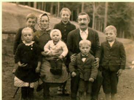
Gospodarjev oče, ki se je priženil na Grizoldovo domačijo, z ženo in otroki