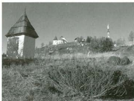
Vrh Uršlje 22. oktobra 2008

Letošnji oktober ali vinotok je bil glede na povprečno mesečno temperaturo med najtoplejšimi v zadnjih sedmih letih. Tudi padavinsko ni bil bogat. Prevladovali so jasni do delno jasni dnevi, več sonca je bilo nad inverzijskim pragom (nad nadmorsko višino 1000 m). Najnižje jutranje dnevne temperature so bile v drugem jesenskem mesecu v koroški regiji med 0° C (10., 19. oktober) in 14° C (29. oktober 2008). V najtoplejših