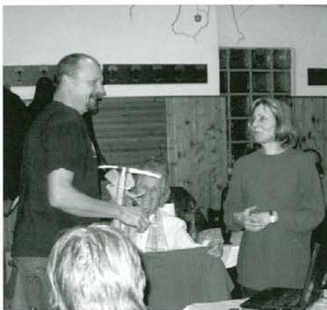
Francu Oderlapu so člani Treske podarili cepin

pogajanj ne gre. Pogajali so se tudi s šoferji, ki natlačijo svoje džipe do take mere, da je vožnja po ovinkasti cesti nad sotesko, v kateri rojni hudournik v velikosti naše Drave, bolj nevarna kot pa vzpon na osemtisočaka. No, kljub temu, da je že precej vozil zgrmelo v te soteske, so se srečno pripeljali do mesta, kjer so postavili bazni tabor.