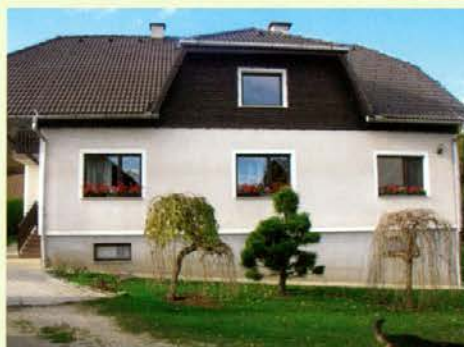
Nova stanovanjska hiša