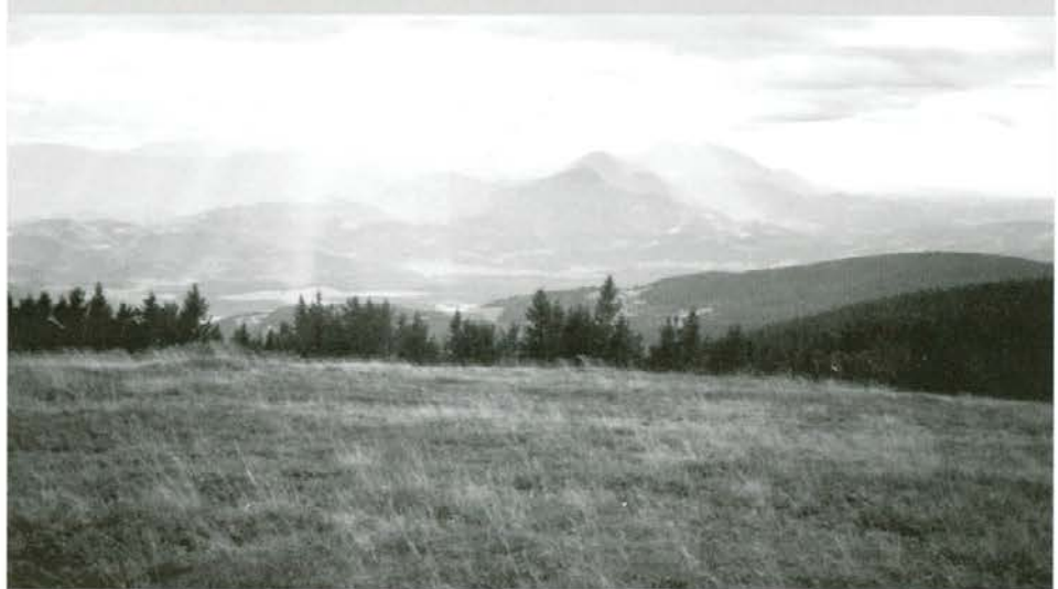
Prikaz fotografij in obrazložitev:

Planja pod Črnim vrhom. Čiščenje zaraščenih pohorskih planjav je dokaz, da če sta prisotni dobra volja in dober namen, se kljub večjemu številu uporabnikov in zainteresiranih da veliko narediti. Ohranili smo del dragocene naravne in kulturne krajine z večjim številom funkcij na istem prostoru.