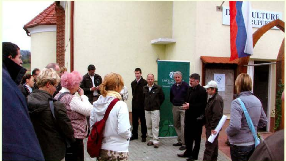
Ekskurzija za novinarje - pred kulturnim domom