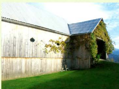
Urejeno gospodarsko poslopje

parazitom, smrekova proti želodčnim, rman, ki ga sušijo in mešajo med otrobe, pa nasploh proti vsem parazitom. V sadovnjaku imajo 120 vrst starih drevesnih sort. Imajo 34 sorte češpljev, iz katerih delajo marmelado, od jablan imajo bobovce, ledrovke, kanadke, carjeviče, ene, ki jih imenujejo limone, ker so sadeži podobni limonom, in nekaj tako starih sort, da jim gospodar ne ve več imena.