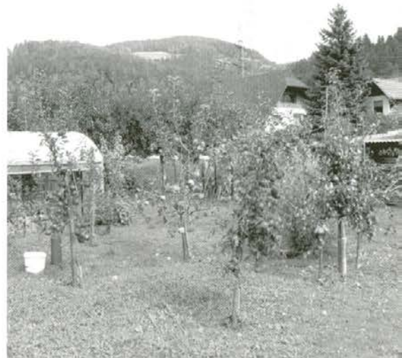
Jablane, stare tri leta

Kmalu za tem ko sem se poročil in odšel od doma, sem si svoj dom zgradil v dolini, kjer je bil tudi idealen kraj za nasad dreves. Pričel sem kupovati sadike jablan in drugega sadja ter jih začel saditi. Ker pa nisem imel znanja o sadjarstvu, predvsem o sajenju in zaščiti, sem bil velikokrat razočaran, saj mi je voluhar uničil korenine