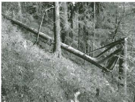
Veter je prelomil bolno smreko

omenjeno žarišče, kjer je detaljno pregledala sušeča se drevesa, ugotovljala primarne in sekundarne povzročitelje umiranja in nabrala večje število lubadarjev in drugih žuželk, namenjenih za raziskavo pod elektronskim mikroskopom. Po njenem mnenju naj bi Langerjeve sitke in navadne smreke v večjem številu navrtali mali osmerozobi smrekovi lubadarji. Rezultati njenih raziskav bodo zanimivi tudi za bralce Viharnika.