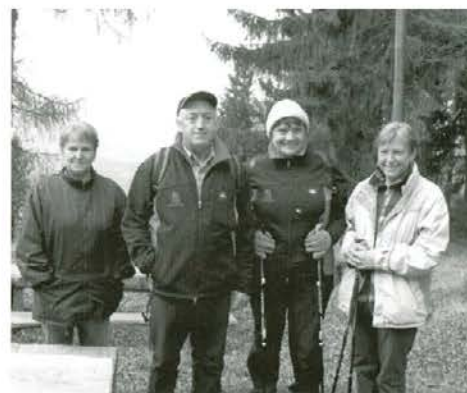
Med pohodniki je bilo kar nekaj članov Društva diabetikov iz Slovenj Gradca