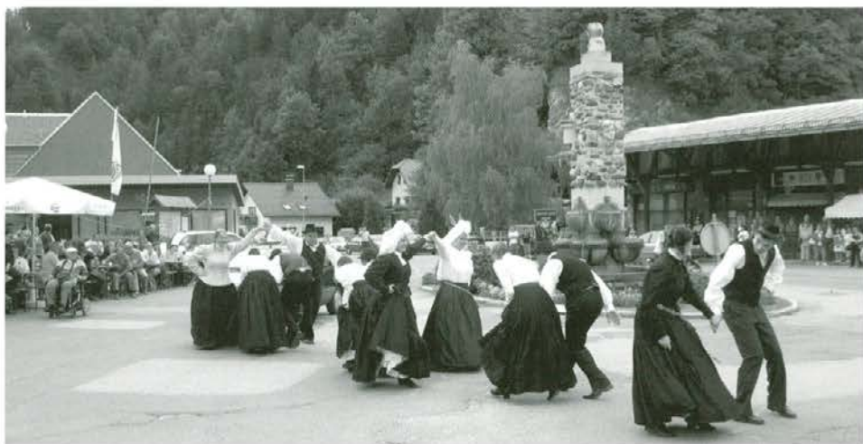
FS Galicija iz Galicije (občina Žalec) je bila živahna tudi v Črni na Koroškem