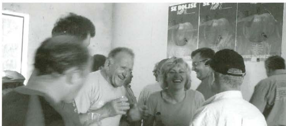
Tako prijazno so nas sprejeli na kmetiji Sadjarstvo Meško v Veliki Nedelji.

Zadnja leta se je v društvo vključilo precej kmetov iz sosednjih krajev, pred leti pa so se pojavili tudi kmetje sadjarji iz Mislinjske in Mežiške doline. Treba je povedati, da so se vključili zelo uspešno z dobro kvaliteto prinesenih vzorcev. Mislinjčani pa so ustanovili svoje društvo s sedežem v Slovenj Gradcu ter ga poimenovali Lesnika. Zadnje čase tudi vse več sodelujejo in morda bo nastala regijska povezava, ki bo imela skupni osnovni cilj vseh sadjarjev, da prenovijo, dosadijo ali pomladijo čim več sadovnjakov. Torej gre