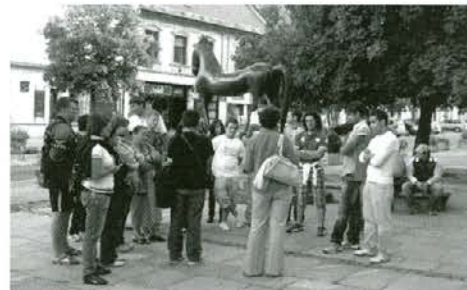
Italijanski folklorni skupini so za dobrodoščilo zaplesali pri Marinu v Šentanelu domačini