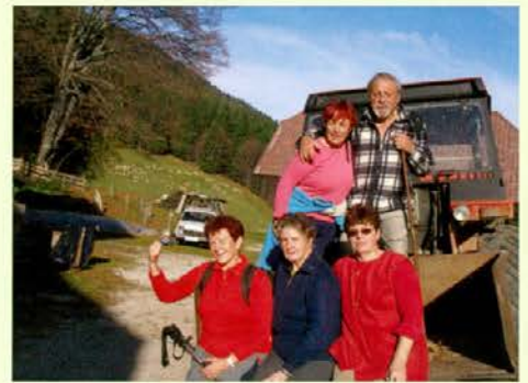
Veliko pohodnikov se ob vrnitvi ustavi tudi na Vernerci

mašo dobesedno nabito polna. Še posebej smo bili obiskovalci veseli, ko smo videli, da se je tudi v notranjosti tega sakralnega spomenika od lanskega leta marsikaj spremenilo in obnovilo. Prav je,