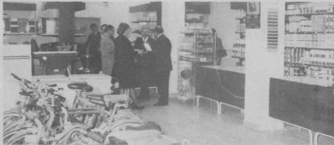
Preurejena notranjost prodajalne Kovina...

Dne 28. aprila 1988 je DO Tabor TOZD Maloprodaja predstavila potrošnikom prenovljeni prodajalni KOVINA in IDEAL, kateri do sedaj s svojim videzom prav gotovo nista bili vzgled urejenosti, vendar sedaj nudita kupcem mnogo lepši videz. Poudariti moramo, da prodajalna KOVINA kljub preurejanju ni bila niti dan zaprta ter da so pri delu veliko postorili prav zaposleni. Prodajalna IDEAL je poleg novega izgleda dobila tudi novo ime »Pehar« in tudi nov izbor prodajnih artiklov. Od sedaj naprej je to prodajalna kruha in delikates, kar so Grosupeljčani že dolgo pogrešali. Pri adaptaciji pa sta pomagali tudi DO Mercator — Pekarna ter TOZD Veleprodaja.