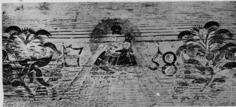
Najstarejša znana naša končnica (Iz l. 1753.).