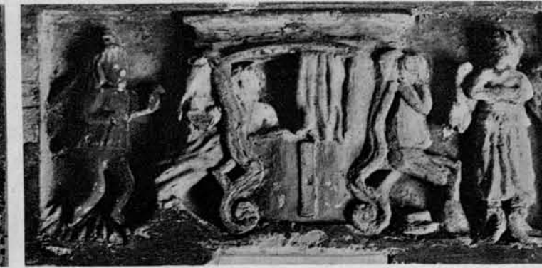
Izpoved (motiv kakor zgoraj); primerek plastične končnice.