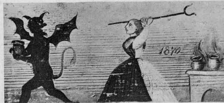
Ženska 'je hujša nego vrag, ker užene celo tega.