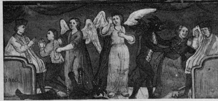
Izpoved (za moškim stoji angel, za žensko vrag, kar naj pomeni, da so ženske večje grešnice nego moški).