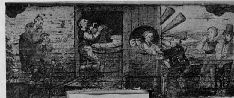
Ženski mlin (na levi mečejo vanj stare, a na desni lete iz njega mlade).