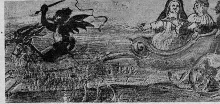
Drag pelje Lutfra in njegovo Katrico v pekel.