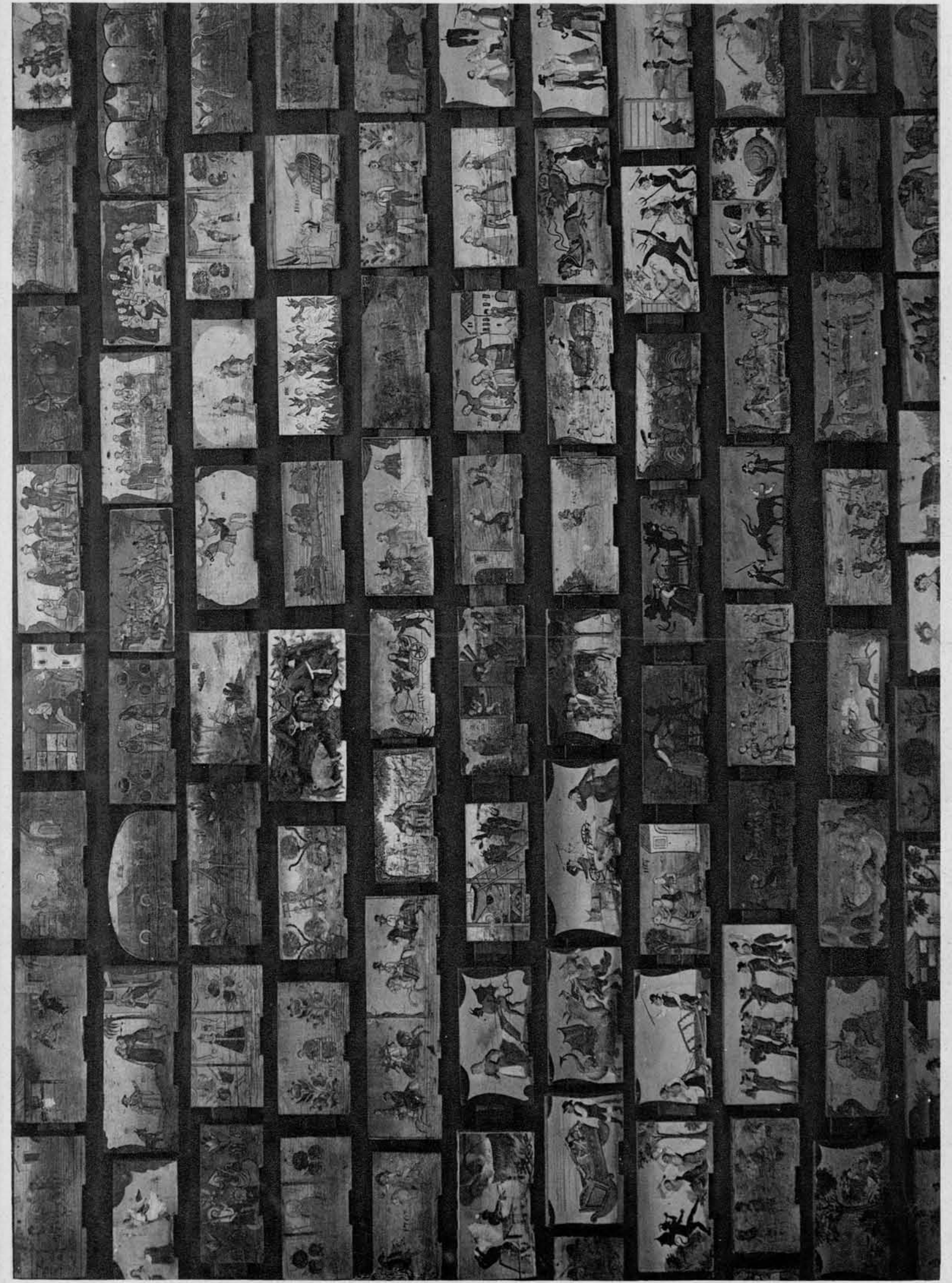
Skupina končnic v ljubljanskem Narodnem muzeju