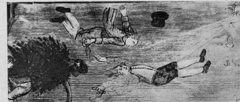
Suši krojači (krojači so tako lahki, da jih nosi veter po zraku). Ženske, krojači in lovci so najpogostejši motivi na končnicah.