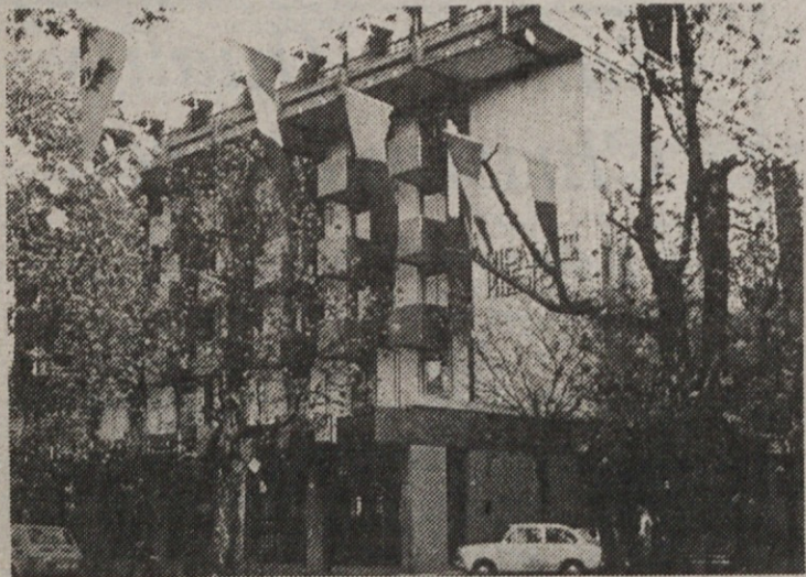
PH-PALACE HOTEL, Corso Italia 63

34 170 Gorizia-Gorica, Italy; Tel.: 0481-82166; Telex 461154 PAL GO I