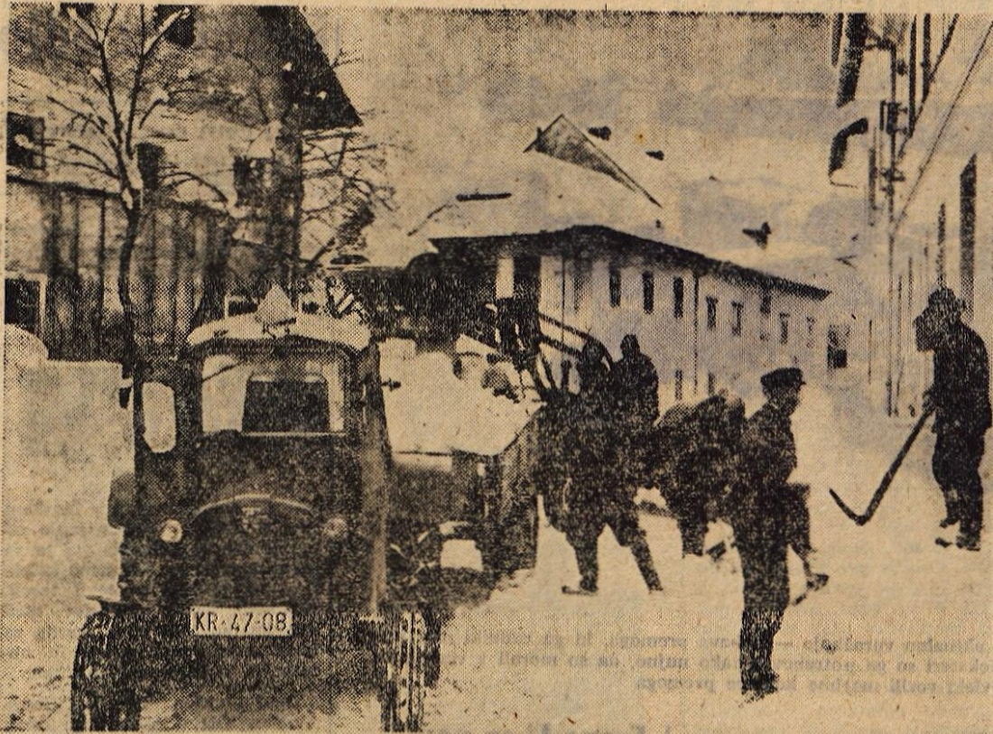
Ceprav je takole čiščenje snega s cest nadvse potrebno, bi ga le kazalo organizirati nekoliko drugače kot v Lescah, ko so pri tem krajevno pot zaprli za četrte ure

Do sedaj so nekatere gospodarske organizacije s pogodbenim pooblastilom reševale nekaj zadev s področja socialnega zavarovanja. Trenutno opravljanje teh poslov nemoteno poteka samo v Zelezarni. Zato njihovi zavarovanci svoje pravice uveljavljajo v Zelezarni. Do konca februarja pa bodo sklenjene pogodbe še z ostalimi večjimi kolektivi, ki bodo želeli biti pooblaščenici za tako delo socialnega zavarovanja. — A. Z.