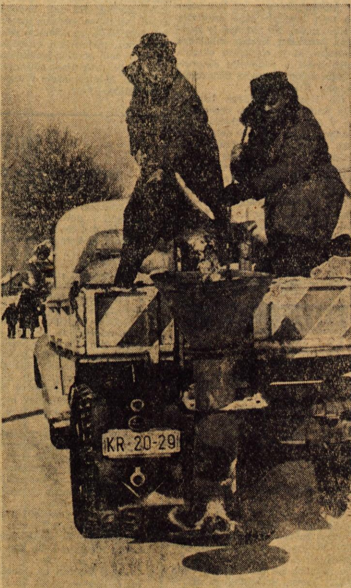
Pričakovali bi, da bodo ob letošnjem snegu večji zastoji prometa na tako imenovanih stranskih cestah. Vendar ni bilo tako, saj so uprava za ceste in komunalna podjetja skrbela, da so tudi z njih čimprej in čimbolj temeljito očistili sneg in cesto s posipanjem usposobili za promet

Mestni muzej Kranj praznuje te dni desetletnico svojega obsto- ja. Iz temeljev, ki so jih položili prvi muzejski delavci v Kranju, se je muzej razvil v eno najbo- gatejših ustanov te vrste na Go- renjskem. Že ob ustanovitvi si je kolektiv zastavil nalogo, da v povezavi z ostalimi muzeji na Gorenjskem prikaže to pokraj- no v njeni zgodovinski, kulturno- zgodovinski, etnografski in umet- nostnozgodovinski podobi. Prav (Nadaljevanje na 2. strani V.)