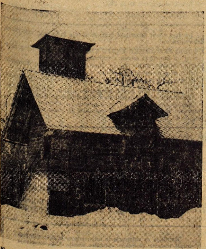
Nov gasivski dom na Koroški Belli je pod streho. Toda doslej so urejeni šele spodnji prostori, ki jih že uporabljajo. Prebivalci Koroške Bele pa so v zadregi, ker jim je zmanjkalo sredstev, da bi si dokončno uredili tudi prostore v prvem nadstropju, ki bi jih predvsem potrebovale družbene organizacije. Kljub temu pa tamkajšnji prebivalci upajo, da jim bo v kratkem s pomočjo občinske gasivske zveze, stanovanjske skupnosti in KZ Dvje-Mojstrana uspelo zbrati manjkajoča sredstva in da si bodo v najkrajšem času nov gasivski dom lahko dokončno uredili