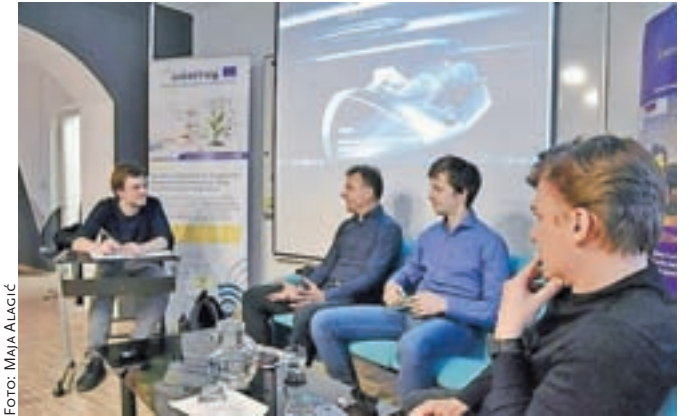
Pogovor z gosti v KIKŠarterju o električni mobilnosti