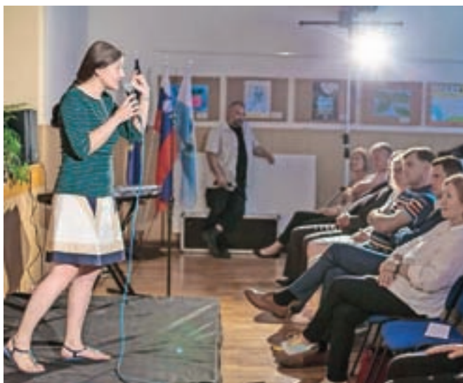
Pripovedovalski večer v Motniku

Medkulturni pripovedovalski večer, na katerem so obiskovalci spoznavali kulturno bogastvo, ki ga v naše okolje prinašajo priseljenci. Skupaj z Jasno Held so prisluhnili pravljicam in zgodbam iz Brazzilije, Bolgarije in Bosne, ki so jih povedali priseljenci sami, večer pa so obogatili še s slovensko ljudsko pesmijo.