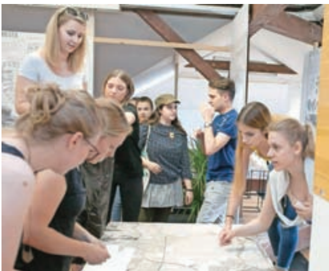
Študenti so pripravili svojo vizijo razvoja somestja Kamnika, Mengša, Domžal in Trzina.

helčič, so se na fakulteti prvič resno lotili celostne obravnave tega velikega območja, pri tem pa študentom pustili precej proste roke. "Realen projekt nastaja v biroju, med študijem pa se nam zdi pomembneje, da študenti odkrivajo nove svote, da gredo izven ustaljenih okvirjev in na ta način zberejo dobre ideje, kijih vrnejo v prostor," je dejal Mihelčič in kot enega od glavnih ciljev projekta izpostavil spodbujanje k razpravi in sodelovanju med občinami. "Med občinami vsekakor prihaja do povezovanja, kar je razvidno tudi iz nekaterih dobrih skupnih projektov, vsekakor pa sodelovanja ni nikdar preveč, še zlasti, ker je to področje tesno povezano in odločitve, sprejete na enem delu, lahko vplivajo na celotno področje," je še poudaril sogovornik, ki upa, da bodo s projektom spodbudili razpravo o urejanju prostora in iskanju celostnih rešitev za to področje. Priložnost za to bo že jeseni, ko bo razstava na ogled v vseh štirih občinah, tudi v Kamniku.