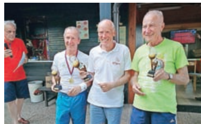
Podelitev pokalov moškim ekipam