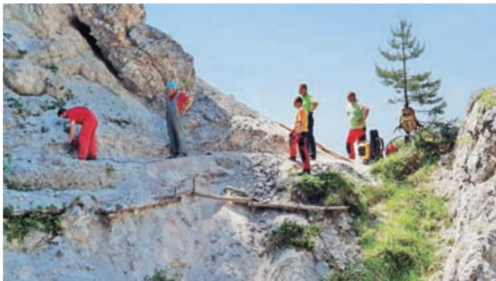
Zahtevna prenova odseka poti na Osredku je končana.