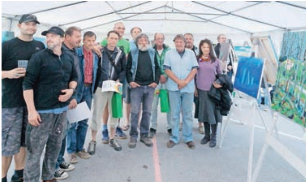
Na ekstemporu je sodelovalo dvajset slikarjev od blizu in daleč.

Izvrstni slikarski dogodek, ki ga je več kot odlično znova organiziralo Športno in kulturno društvo Sela, je navdušil tako sodelujoče kot številne obiskovalce. Ocenjevanje likovnih del je potekalo po sistemu ArtOpen, kjer razstavljene slike ocenjujejo tako udeleženci in obiskovalci ekstempora kot tudi strokovna žirija, ki sta jo tokrat sestavljala Uršula Lenšček in Tomaž Schlegl. Zmagovalna umetnina je tako postala tista z največ zbranimi točkami. Po mnenju slikarjev in obiskovalcev