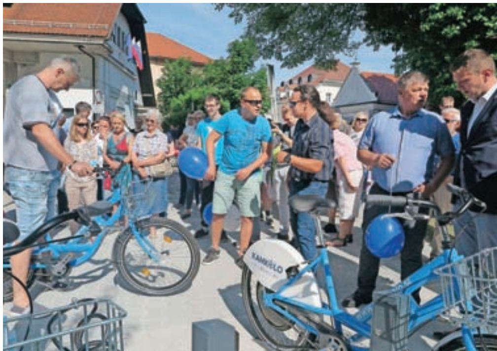
Predstavitve sistema Kamkolo je med občani naletela na precej zanimanja.