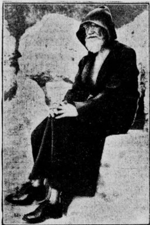
Bernard Shaw, veliki irski pisatelj in politik, ki se je pravkar uničujoče izrazil o Društvu narodov kot veliki laži.

Danska se more ponašati, da ima najvišje izobraženega kmeta na svetu, s tem pa ob enem najbolj razvito kmetijstvo in za demokracijo zrelo ljudstvo. Za vse to se ima zahvaliti svojim ljudskim visokim šolam, ki so danška posebnost.