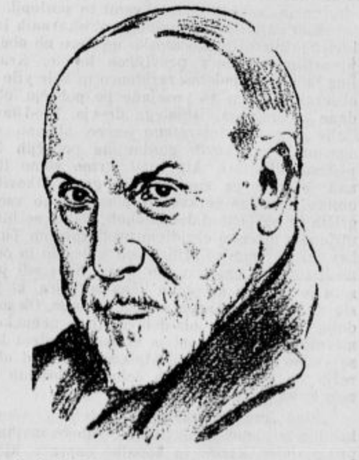
Prof. Luigi Pirandello, sloviti italijanski dramatik in gledališki ravnatelj v Rimu, ki pride s svojimi igralci na gostovanje po Srednji Evropi.

Draga razstava. Razstava »Pressa« v Koelnu se je zaključila s primanjkljajem v višini 36 milijonov mark.