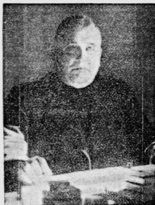
Predsednik državlce Slovaške in njene vlade msgr. Tiso