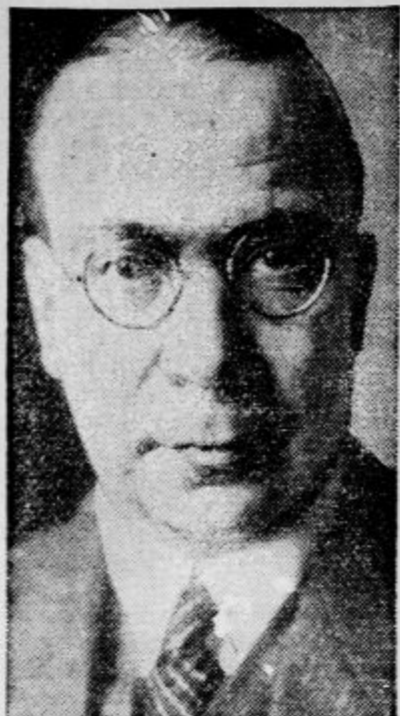
Češki zunanji minister dr. Chvalkovsky