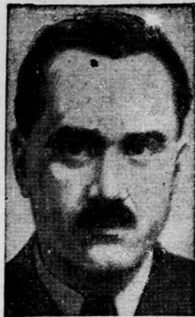
Slovaški notranji minister Sidor