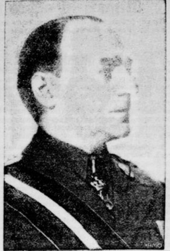
Zaradi smrti patriarha Mirona je bil imenovan za novega šefa bukareštvoske vlade dosedanji notranji minister Calinescu