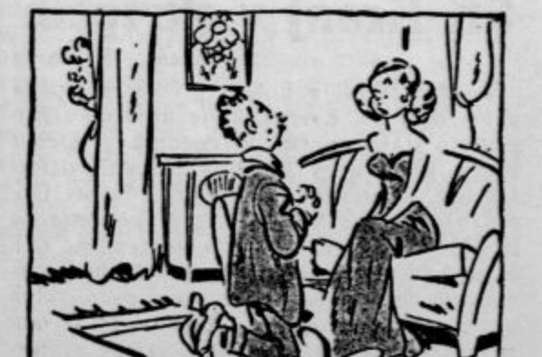
»Preden te prosim za roko, povej mi, ali se bo po poroki tvoja mati preselila k tebi?« (»Everybody's weekly«)