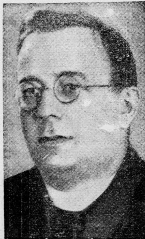
Predsednik podkarpatske vlade monsignor Vološin