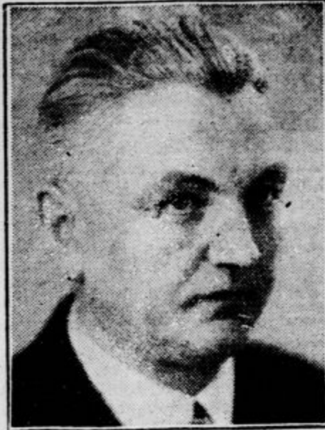
Slovaški minister prosvete Šivák