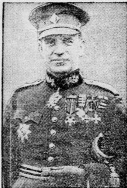
Voditelj čeških fašistov general Gajda

razvoj bo torej odgovoril na mnoga vprašanja, ki so danes v čeških in gotovo tudi mnogih slovaških srcih. Ko so bili ti komentariji na ulicah, usoda Češke in moravske dežele še ni bila definitivno odločena. Članki so še polni vere v novo bodočnost, naj se zgodi karkoli, kakor poudarjajo vsi praški listi brez izjeme. »Narodni listi« pišejo v svojem uvodniku med drugim: »Češki narod ne bo opustil onega, kar je tako rad videl pri drugih: on ne bo zapustil poti razuma in pameti, ki mu bo pomagala prenesti vse težave. Danes ne more nihče v Evropi predvidevati, kaj bo jutri. S tem nepotrebnim ugibanjem in tratenjem časa si tudi mi ne bomo belili glav. Vemo, da nam modrost nalaga, da se še tesneje medsebojno povežemo in da ostanemo zvesti samim sebi. Tisoč let smo že v sruču Evrope. Preživeli smo dobo slave in ponižani. Toda nikdar nismo izgubili zvestobo do svoje zemlje, dokler smo dihali. Bilo bi nemodro, ako bi sedaj vzdihovali. Pametno pa je, ako sedaj z razumom delamo in vztrajamo.«