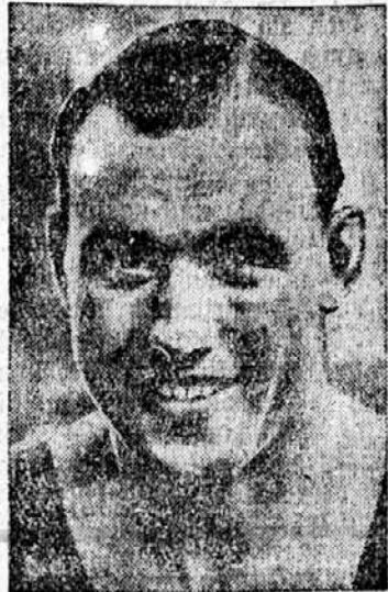
Sharkey novi svetovni boksarski prvak.