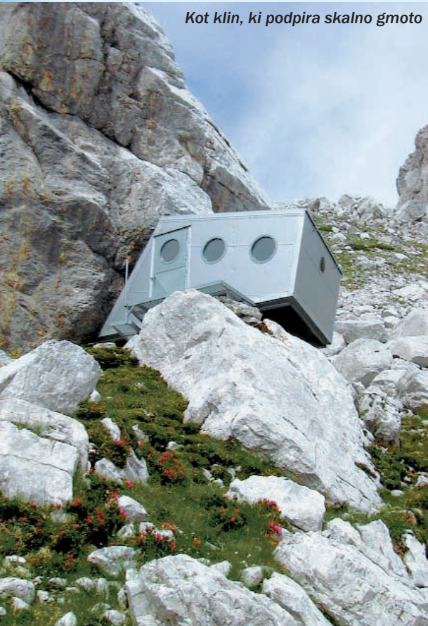
Kot klin, ki podpira skalno gmoto

opremljenost. Tisti, ki v njem išče udobje, bo razočaran - ne bo našel ogrevanja, kopalnice in stranišča. Za življenje tu bo moral vse prinesiti s seboj, tako da v bivaku zagotovo ne bo turistov ali »kvaziplanincev«. Že več kot četrto stoletja so bivaki v Julijcih odklenjeni in znane so tudi težave - kje pa jih ni?