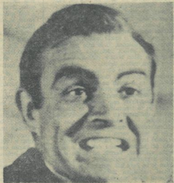
velikega, širnega sveta. Celu za naraščaj navdušenih staršev je poskrbljeno, s cinastimi figurami si lahko zgradijo na preprogi »Bondov neverjetni sveta«.

Navdušenje nad brutalnimi spopadi, zaradi katerega očitajo avtorju sadizem, masohizem in fašizem, se ne ustavi pri branju in gledanju filma. Obsežna produkcija moških potrošniških izdelkov se z dobrohotnostjo Bond-fansov razcveta do upoštevanja vredne gospodarske razsežnosti. Številni 007-artikli, h katerim je najbrž treba računati tudi črne »Golfinger-Dessous«-e, obsegajo tako preproste 007-suknjičice (s 24 skrivnimi žepi, ki jih ne najde niti vaša žena) in pižame iste številčne kombinacije, kakor tudi parfume, pijače in kar je še potrebnih našega