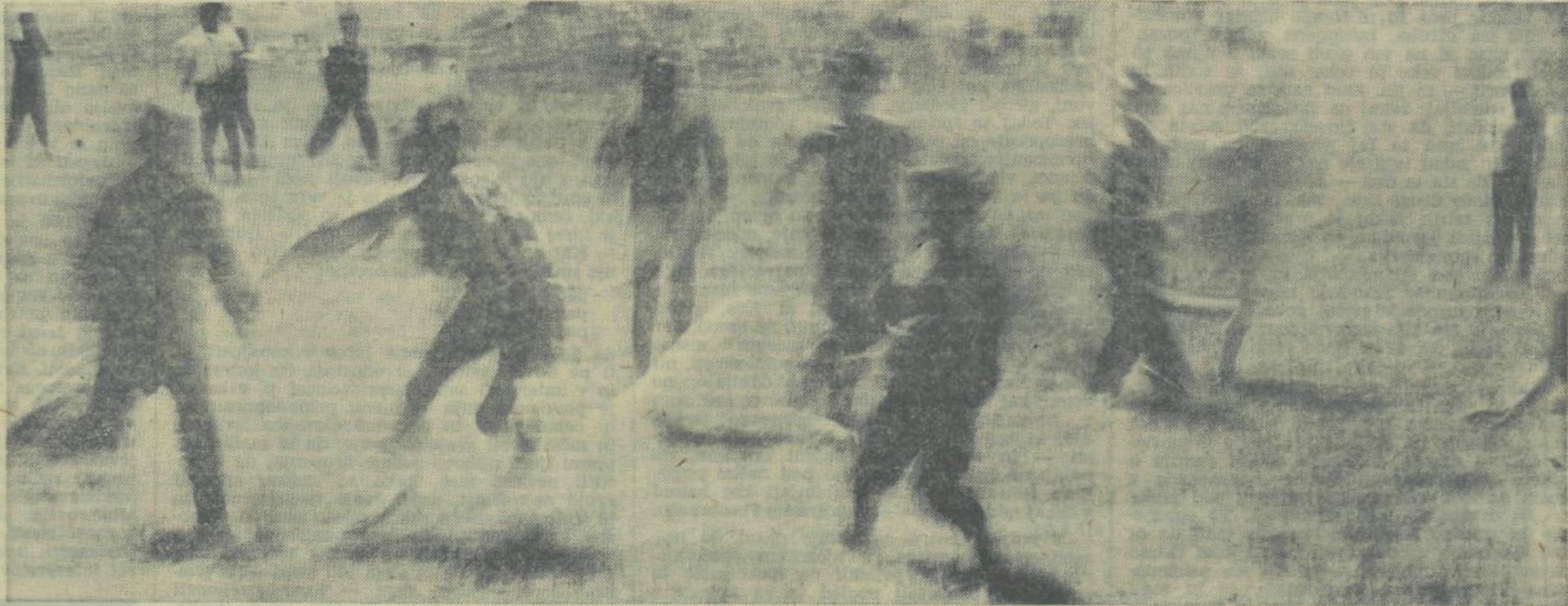
Dinamika igre