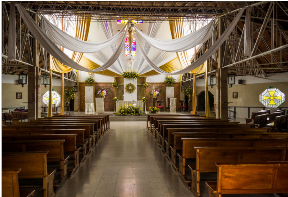
Notranjost župnijske cerkve sv. Frančiška Saleškega v barriu Aures, ki spada v okvir salezijanskega poslanstva Ciudad Don Bosco