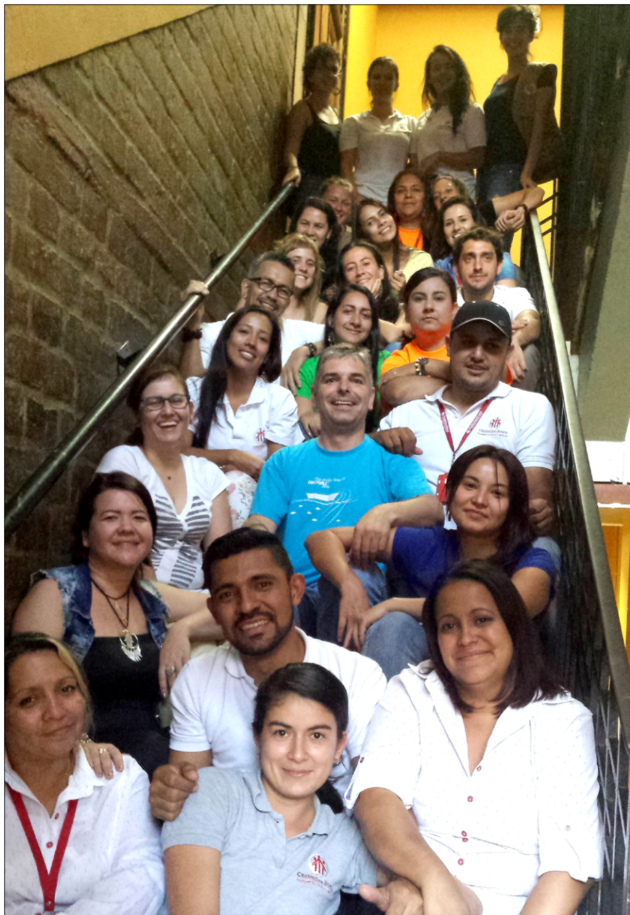
Kolektiv Derecho a soñar