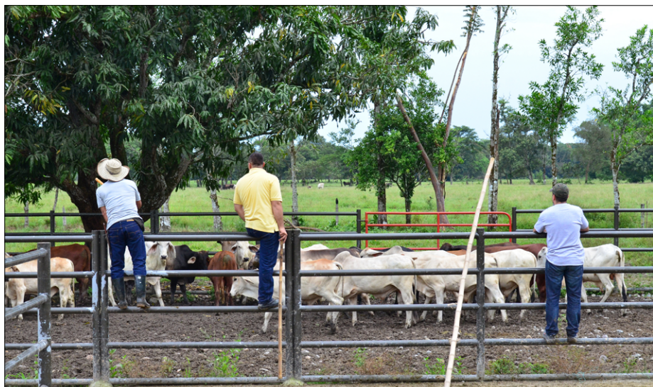
Pregled živine na salezijanskem ranču v El Castillu

Končno smo prišli na ravnino. Pravzaprav na obrobje velikanske amazon-