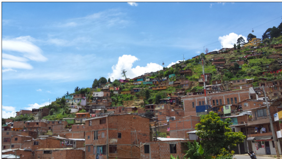
Največja zgradba je nastajajoča nova cerkev v Carpinelu