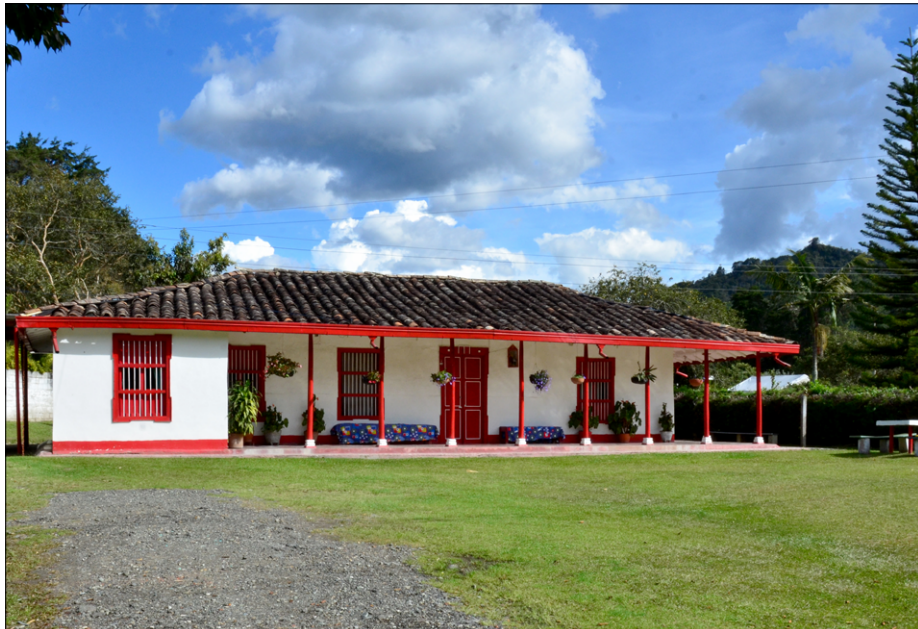
Tipična podeželska hiša pokrajine Antioquia, v kraju Rio Negro