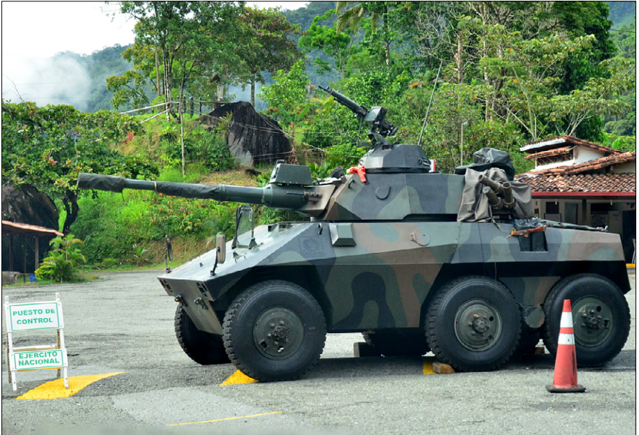
Vojaške patrulje so na vseh glavnih cestah po državi