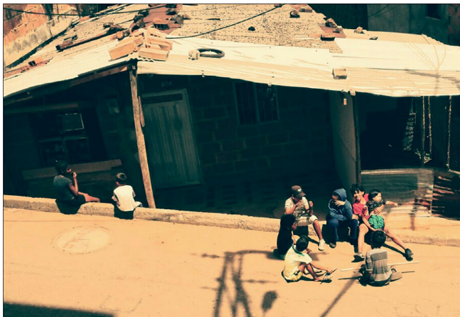
Vsakdan na ulici barria Bello Oriente