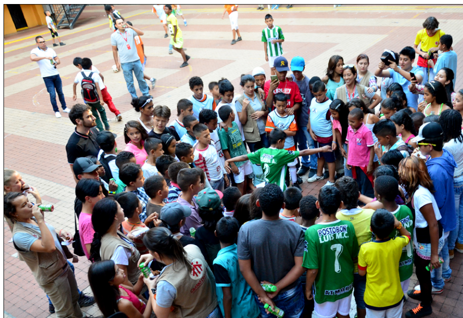
Otroci iz barriosov, zbrani na prireditvi Festival de talentos, na dvorišču salezijanskega zavoda Patio Don Bosco