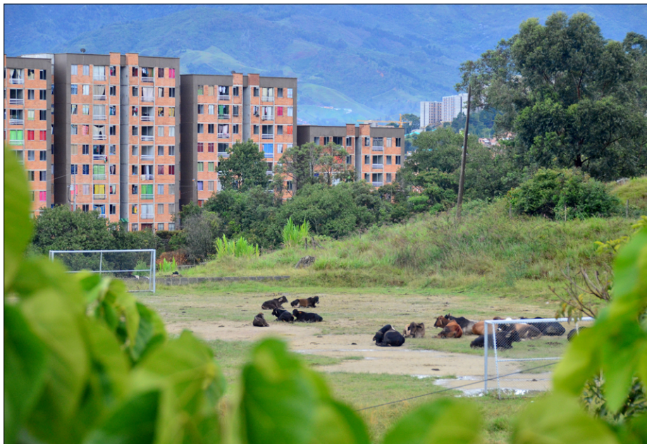
Stolpnice nadomeščajo barakarska naselja, a življenje ostaja enako ...