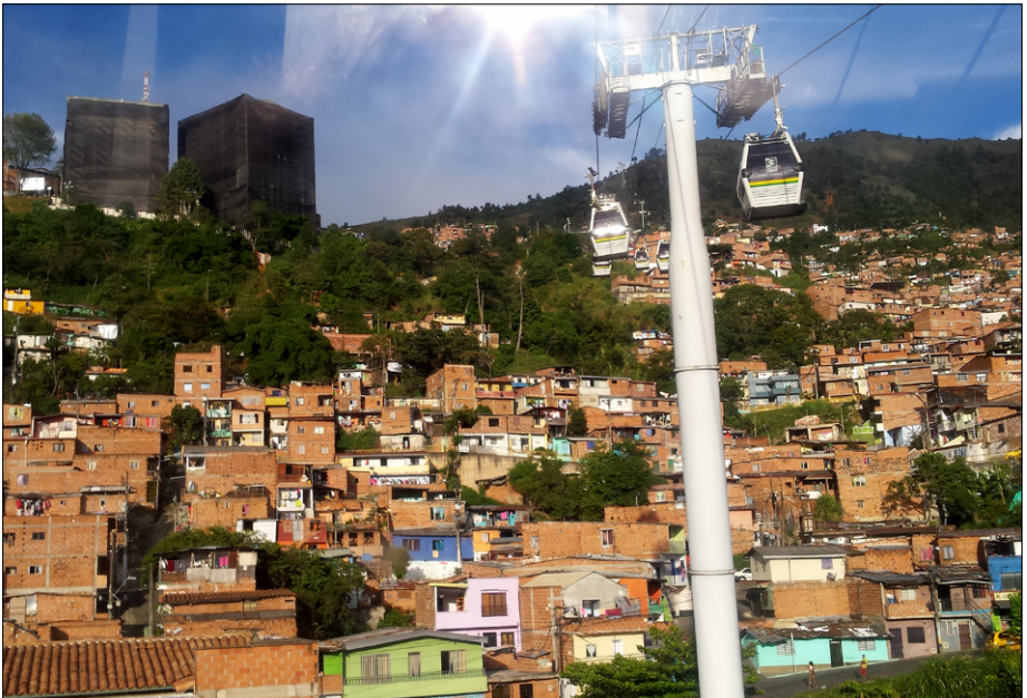
Pogled z mestne vzpenjače Santo Domingo Savio na zgradbo Biblioteca España v komuni 1, ki je v sanaciji zaradi prehitre in nekvalitetne gradnje