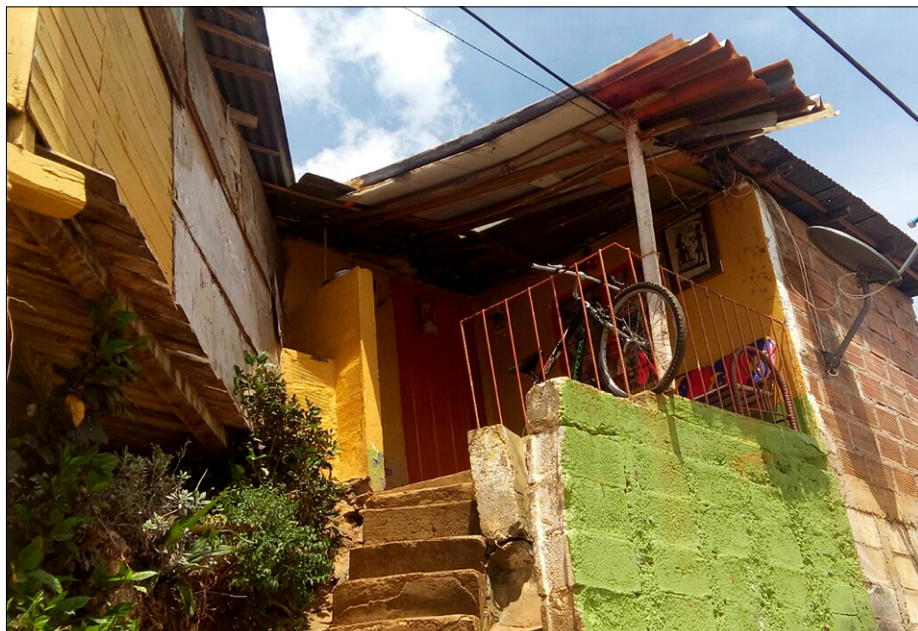
Blišč in beda barakarskih naselij, prislonjenih ob bregove Medellina