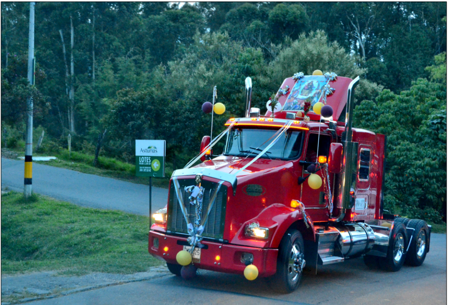
Okrašen tovornjak se pelje na procesijo, na praznik karmelske Matere Božje, ki je v Kolumbiji zavetnica šoferjev