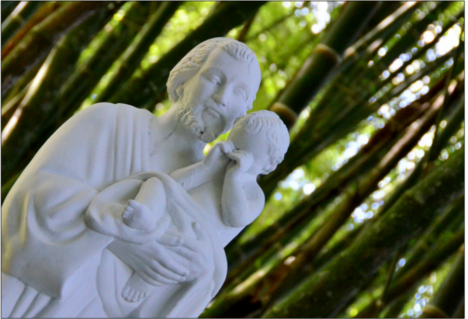
Kip sv. Jožefa z jokajočim Jezuščkom sredi bambusovega parka, ki leži ob salezijanskem noviciatu v kraju La Ceja, kakih 40 km JV od Medellina