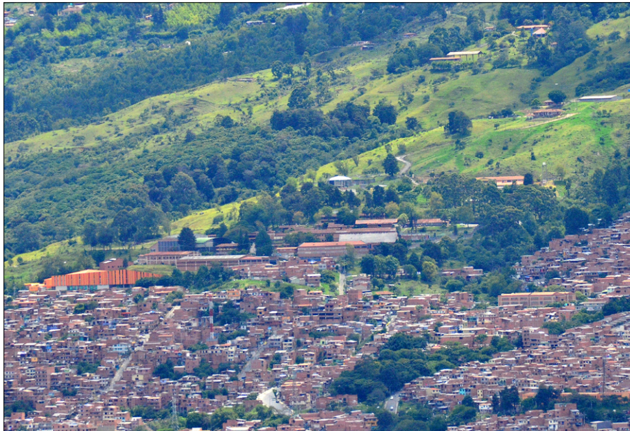
Pogled iz barria Bello Oriente na Ciudad Don Bosco v barriu Aures. Zgoraj desno posestvo Balcones.