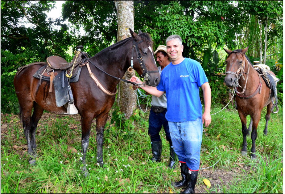
Na salezijanskem posestvu v 600 km oddaljenem Villavicenciu, na amazonski ravnici