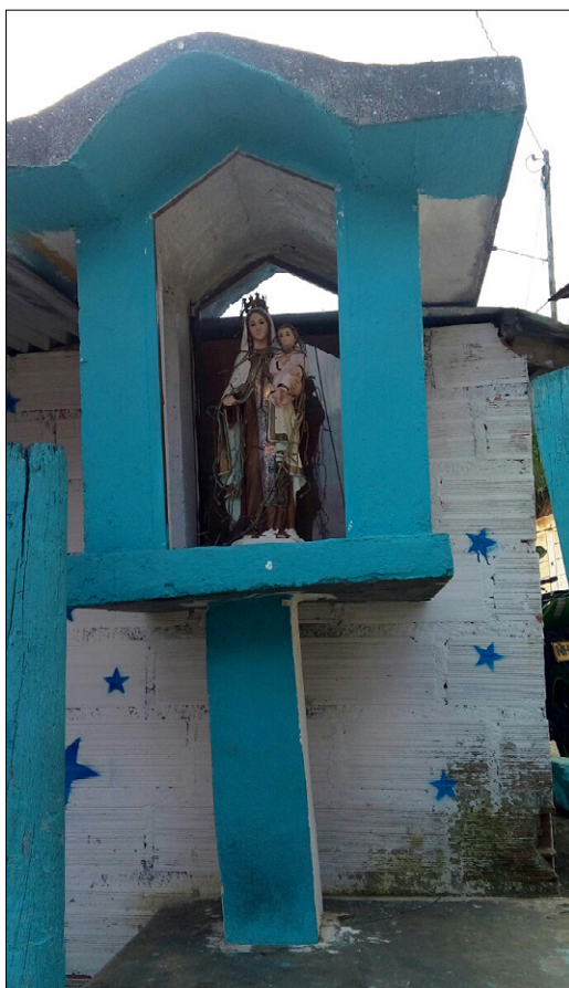
Barriosi so polni znamenj in preprostih kapelic s svetimi podobami

Salezijanski center od ponedeljka do petka obiskuje 120 otrok iz 83 družin v dveh izmenah. Poleg strokovnega spremljanja psihologov, socialnih delavcev, pedagogov, zdravnikov in prostovoljcev otroci dobijo tudi kosilo in malico. Deležni so učne pomoči ter se vključujejo v razne ročne delavnice ter v učne programe o zdravju, drogah in zaposlovanju.