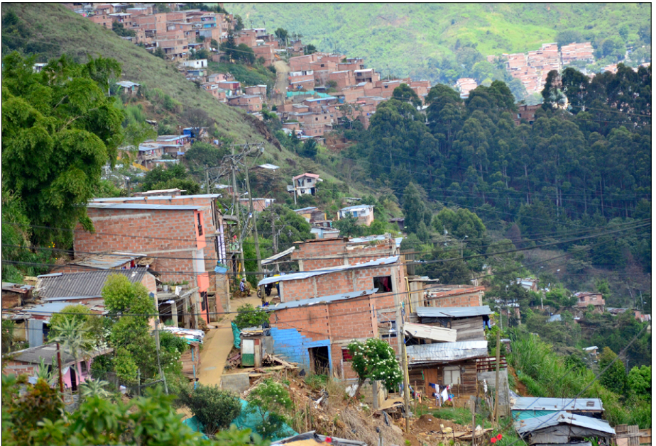
Še en pogled na barake in domove, ki rastejo eden za drugim ...