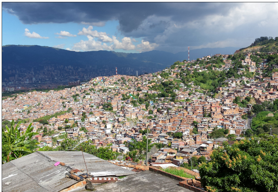
Pogled iz barria El Salado na sosednji breg San Javier, bolj znan kot komuna 13