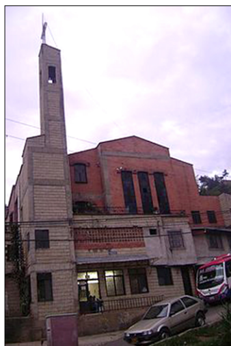
Cerkev v barriu La Sierra