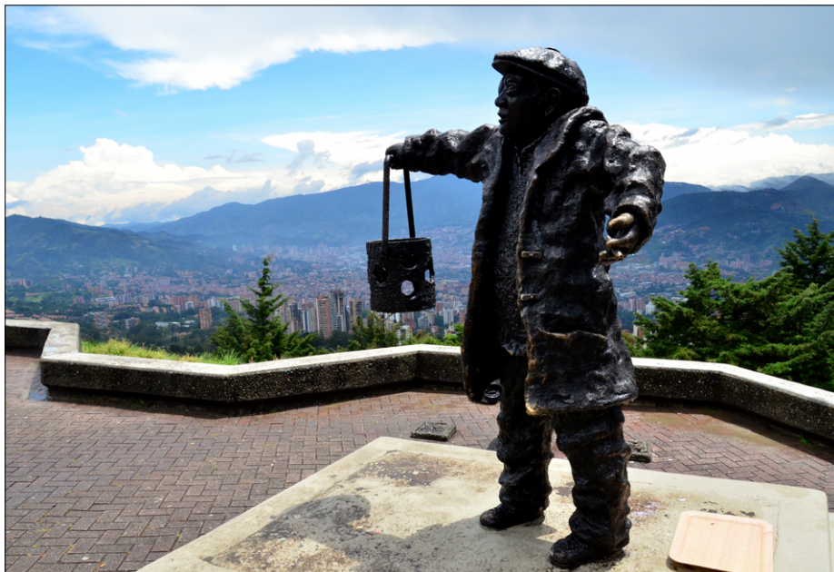
Kip El Farolero kraljuje na razgledniku Mirador de palmas, v ozadju južni del Medellina