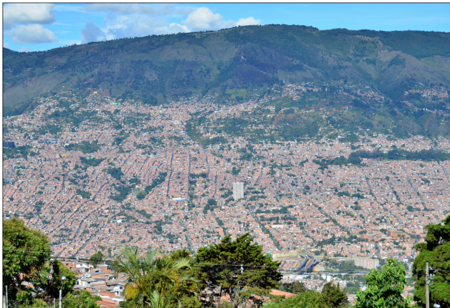
Pogled na barriose, ki se raztezajo po vzhodnih pobočjih Medellina