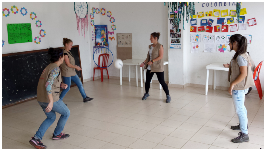
“Prosti čas” prostovoljk

Za otroke je tu potrebno narediti kar največ. Ko bi vsaj starši tudi to razumeli.