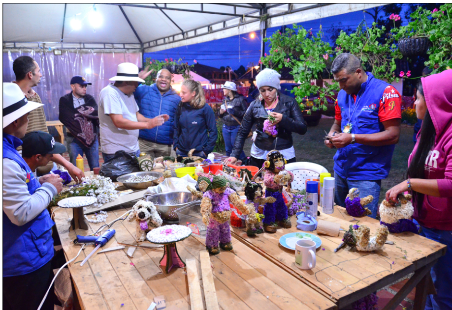
Vaščani Svete Helene se pripravljajo na medellinski festival Feria de las Flores