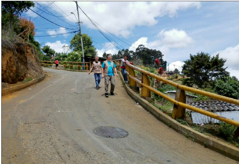
Ovinkasta in strma cesta v Bello Oriente