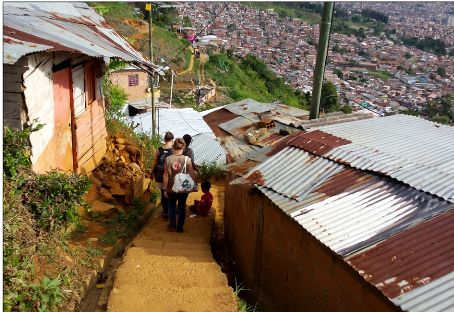
Spust med barakami iz barria Bello Oriente v center Medellina