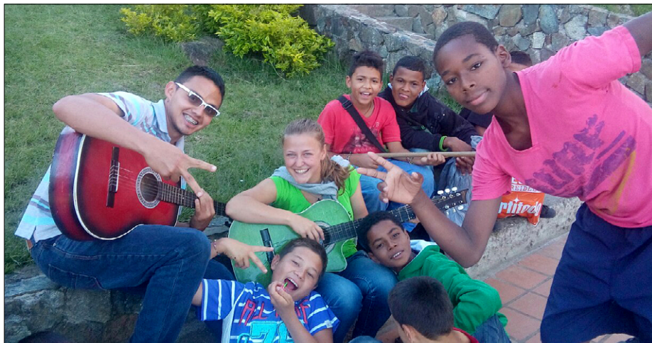
Z otroci iz Ciudad Don Bosco po nedeljski sveti maši