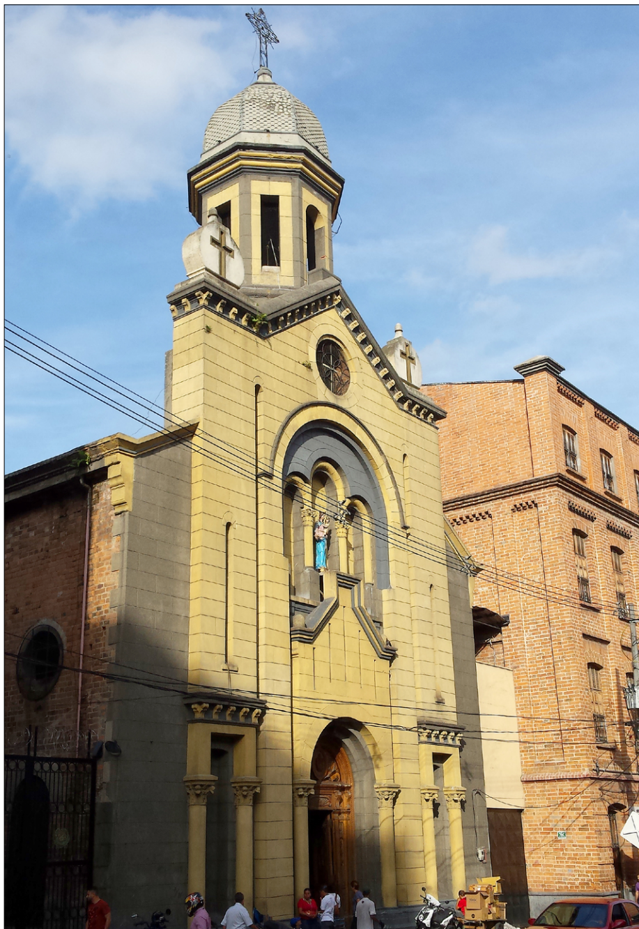
Cerkev Marije Pomočnice, prvo v Kolumbiji, so zgradili v Medellinu ob salezijanskem zavodu Patio Don Bosco