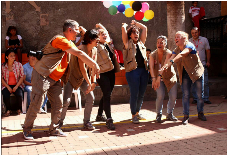
Prostovoljci Derecha a soňar na prireditvi Festival de talentos