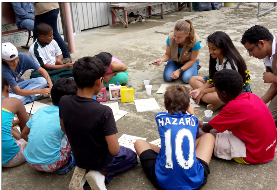
Delavnice s skupino otrok v barriu El Salado