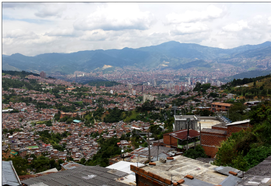
Pogled na Medellín iz barria La Sierra