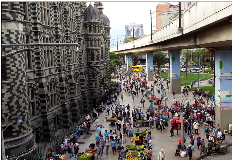
Pogled z nadzemne železniške postaje Parque Berrio na mestni vrvež ob Palacio de la Cultura Rafael Uribe Uribe