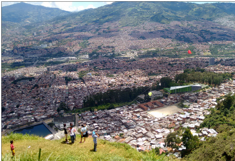
Spušcanje zmajev na razgledni ploščadi v barriu Bello Oriente