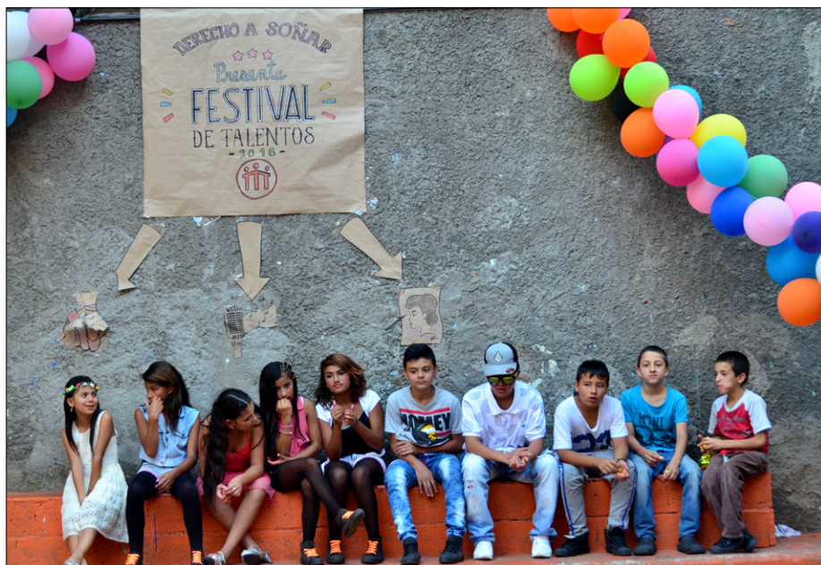
Otroci čakajo na nastop na prireditvi Festival de talentos