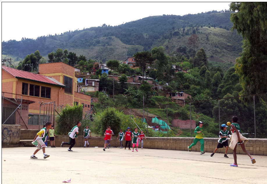
Na šolskem igrišču v Bello Oriente