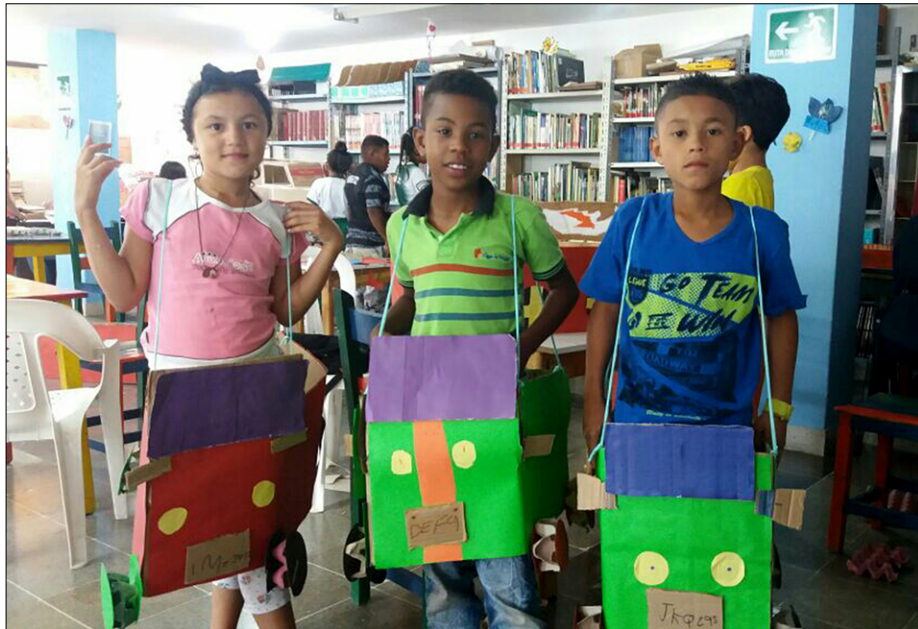
Otrovi na delavnicah v barriu La Sierra