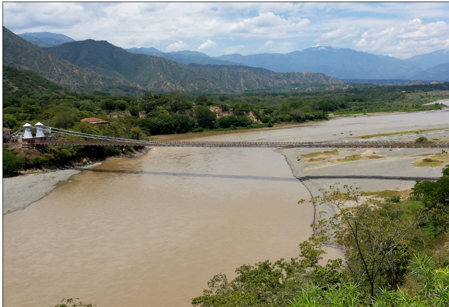
Leseni viseči most Puente del Occidente (Zahodni most) čez reko Cauco so zgradili leta 1895. Dolg je 291 metrov.