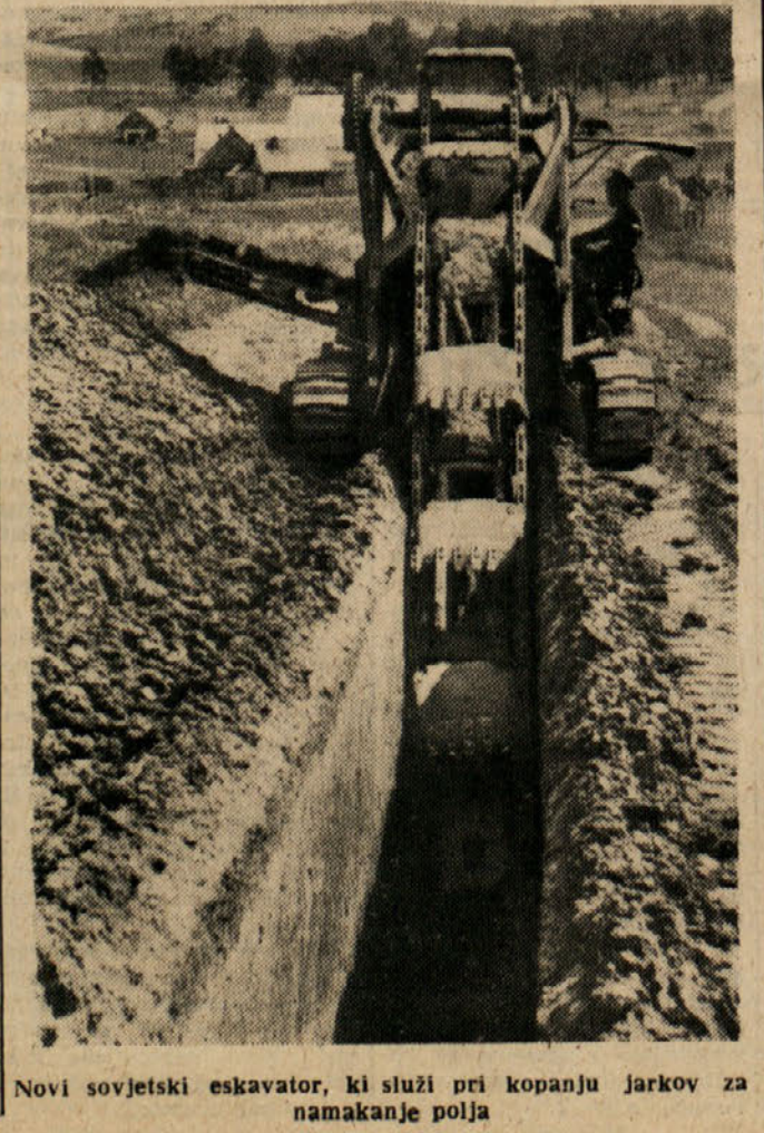
Novi sovjetski eskavator, ki služi pri kopanju jarkov za namakanje polja