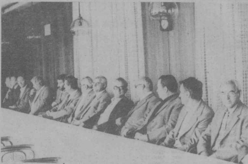
S slavnostne seje krajevnih skupnosti Stožice