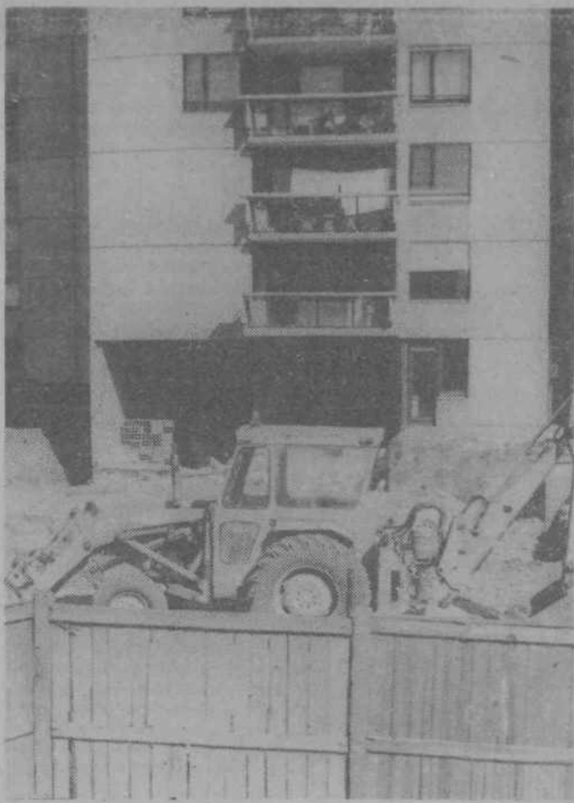
Stolpnici E in F v krajevnih skupnostih Ivan Kavčič in Jože Štembal bosta predvidoma še letos sprejeli malčke v dve novi vzgojno-varstveni enoti za skupaj 160 otrok.

O veliki partizanski zmagi na Turjaku berite na strani 5.