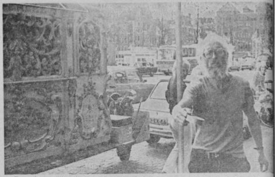
Z amsterdamskih ulic še vedno niso izginile starodavne lajne. Toda, kdor lajnarja opehari, ga slika in mu ne da kovanca, lahko kaj hitro stakne breco.

Nizozemska je bogata dežela. Morda preveč bogata. A vsaj tako tudi revna. Le da je revščina skrita pred radovednimi očmi in jo lahko zazna le občutljivo oko ob posebnih priložnostih, ko sitno pokuka v koticah, namenjen turistični bombastičnosti zanimive dežele.