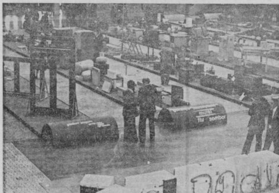
Bogata paša za oči se odpira opazovalcu Gorenje, garancija in kakovost — razstava v množičnem potruje ta že znana gesla.

Nova hala za proizvodnjo avtomehanskega orodja bo pomenila tudi novo osnovo za osvajanje tujih tržišč. Ze sedaj izvaža Kovaška industrija svoje izdelke na vseh pet svetovnih kontinentov in pri tem dosega lepe uspehe. Tako je na primer v letu 1971 izvozila za okrog 5 milijonov dinarjev ročnega orodja, v letu 1976 je dosegla že za več kot 31 milijonov dinarjev izvoza, v letošnjem letu pa v Kovaški industriji realno pričakujejo za 45 milijonov dinarjev izvoza ročnega orodja brez odkovkov. Kljub temu pa se v tej zreški tovarni zavedajo, da so možnosti za izvoz njihovih izdelkov še zelo velike. Zato vlagajo veliko naporov v izboljšanje kvalitete izdelkov ter v razširjanje proizvodnega programa, da bi tako omogočili še intenzivnejše osvajanje tujih tržišč DAMJANA STAMEJOVIČ