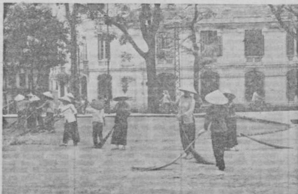
Poznavalci kontinentalne jugovzhodne Azije pravijo, da je Vietnam urejena in čista dežela. V bogatih in številnih parkih glavnega mesta Hanoija skrbijo za red takšnih »oddelkih« pometačev.