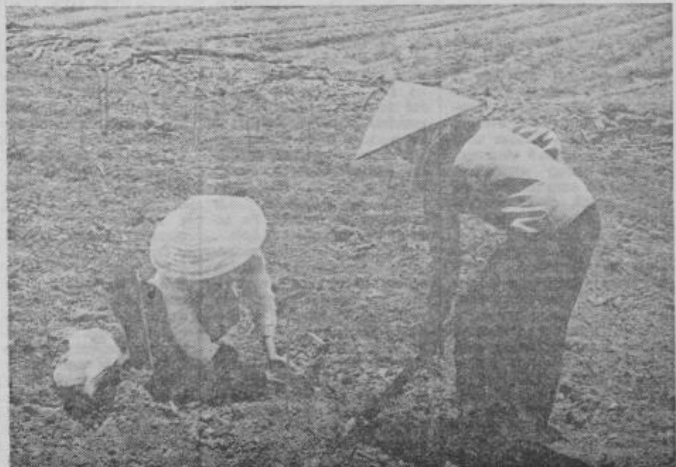
Gospodarska dejavnost v novih ekonomskih conah je predvsem kmetijska. Cona ima plan razvoja in službe za njegovo izvajanje. Med službami ima posebno mesto seveda kmetijska pospeševalna služba.