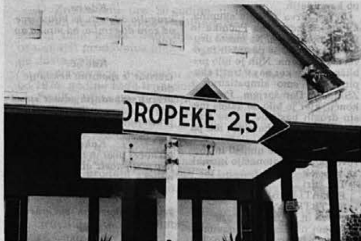
Cestna sporočila so šibka točka Žirov