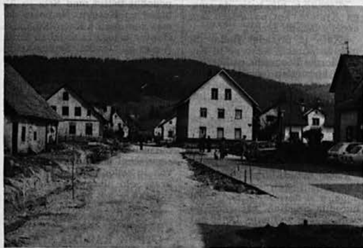
Gradnja nove ceste s pločniki skozi Žiri se nadaljuje