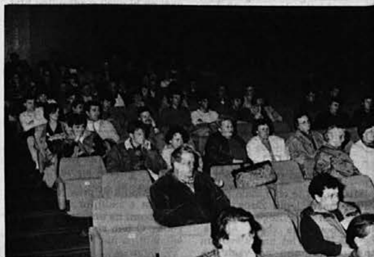
S predvolilne konvencije ZSMS — liberalne stranke