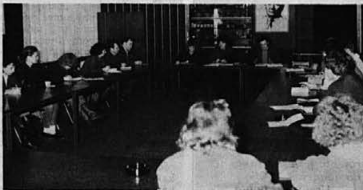
Pred volitvami še posvet s predsedniki volilnih odborov