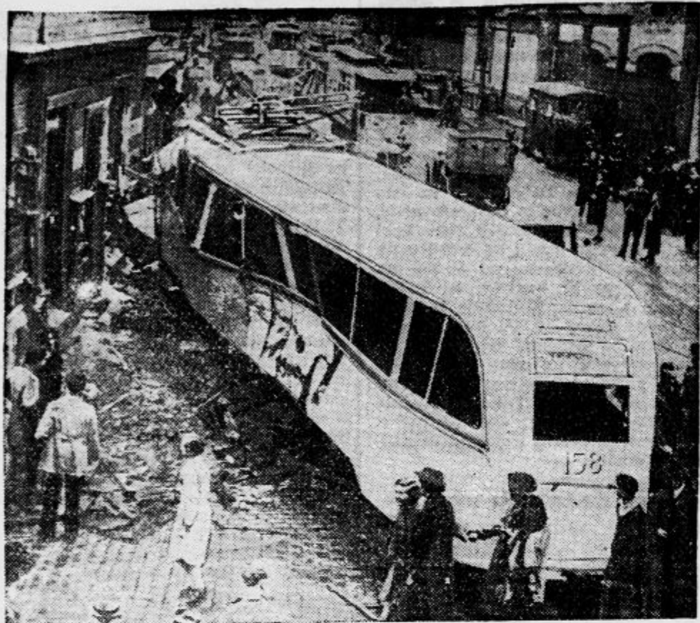
V norveški prestolnici se je primerila te dni neobičajna nesreča. Neki tramvajski voz se je zaradi prehitre vožnje iztiril in se zaletel v obcestni zid ter poškodoval dva avtomobila ob njem. Dva potnika sta se pri tem ubila, več pa je bilo ranjenih