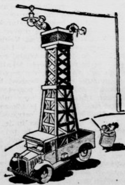
Možakar, ki je hotel najeti poseben voz za opazovanje londonskih svečanosti... »Everybody's week!«