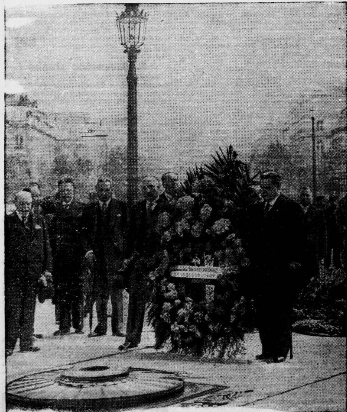
Te dni se muči v Parizu naša parlamentarna delegacija, ki je položila na grob Neznane junaka pri Arc de Triumphe krasen spomenik