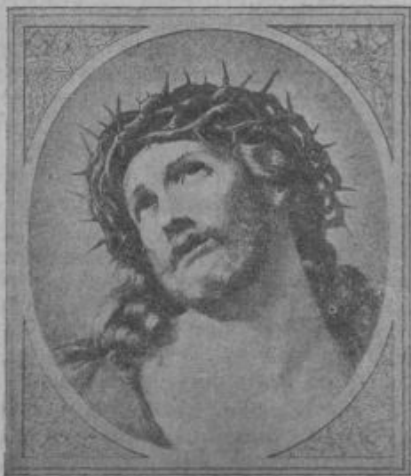
Jezuš je noso trnjavo korono, naj zadosti za grehe mišljenja.