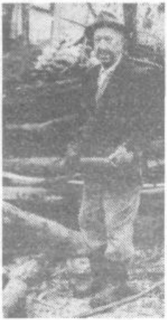
Pred zimo je treba poskrbeti predvsem za kurjavo