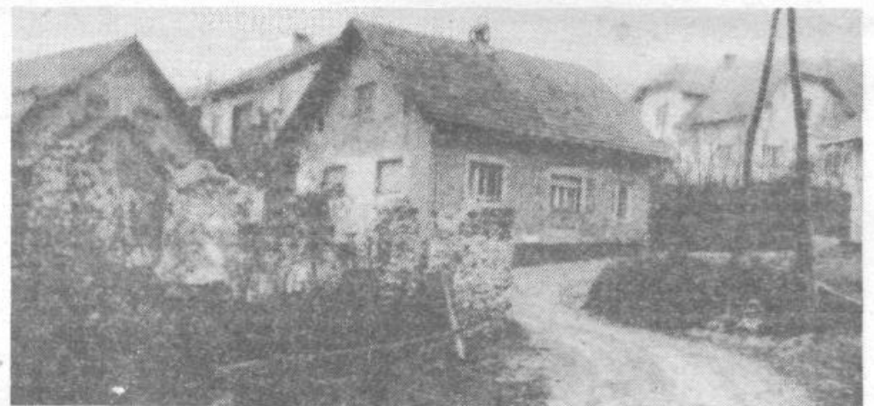
Bodo prijazne domačije na Gornjem Igu nekoč ostale povsem prazne?

Se to. Po sprejemu srednjeročnega plana je bil ustanovljen Sklad za urejanje stavbnih zemljišč, ki je prevzel nekatere določene naloge, ki so bile zajete v KSLO in je to pri rebalansu potrebno upoštevati. (npr. širjenje pokopališč). Kaj se določa s prvo in kaj z drugo prioriteto? S prvo se določijo konkretne planske naloge s konkretno zagotavljenimi viri, drugo pa planske naloge, ki jih bo možno realizirati v tem srednjeročnem obdobju le, če bodo na razpolago presežena sredstva, oziroma če bodo izpadle konkretne naloge iz prve prioritete.