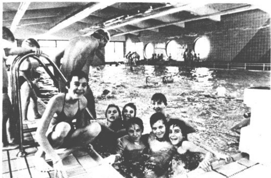
OBNOVILI ZIMSKI BAZEN — V nedeljo so ljubitelji plavanja po dolgem času znova lahko zaplavali v zimskem bazenu v Titovem Velenju. Bazeni so obnovili, stroški za to so bili kar precejšnji. Toda ob užitkih bodo ti kmalu pozabljeni. Ostal pa bo prepotrben objekt.