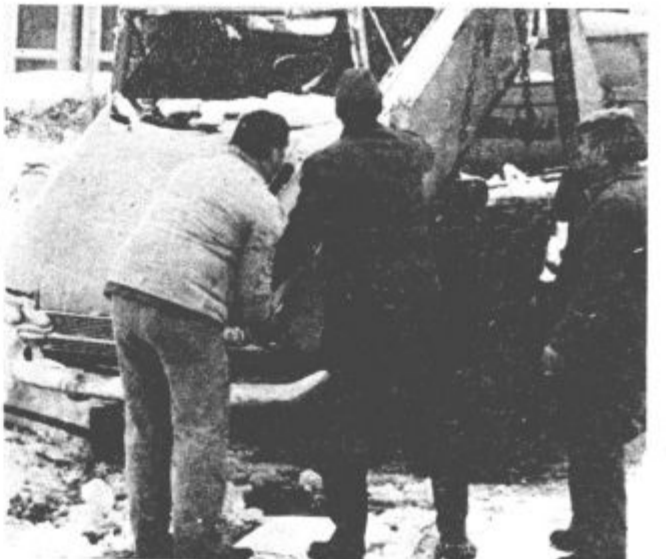
Takole so delavci Vekosa pred dnevi v Titovem Velenju odstranili prvo »zapuščeno« vozilo