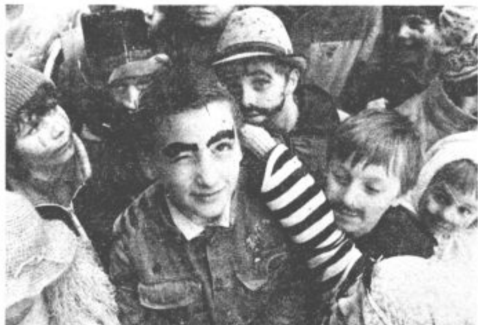
Med uspeli prireditvami v zadnjem času je tudi otroška maškarda, ki so jo pripravili na Kardeljevem trgu

vo. Ozvezdje lahko tudi ovira potenciala, ki jih ima planet. Med seboj so si lahko planeti prijateljski, lahko pa tudi sovražni. Tako nekako smo razumeli. No, zdaj bomo pa morali malo zaplesti. Vsega namreč tudi nismo razumeli, takrat, ko nam je Martin pripovedoval, pa smo mislili, da nam je vse kristalno jasno. Martin je namreč potem na našem primeru pokazal neke hiše (kaj nam pišejo zvezde, ne izdamo). Te hiše pa predstavljajo posamezna področja človekovega življenja. Dvanajst jih je. Iz prve Martin razbere osebnost, druga