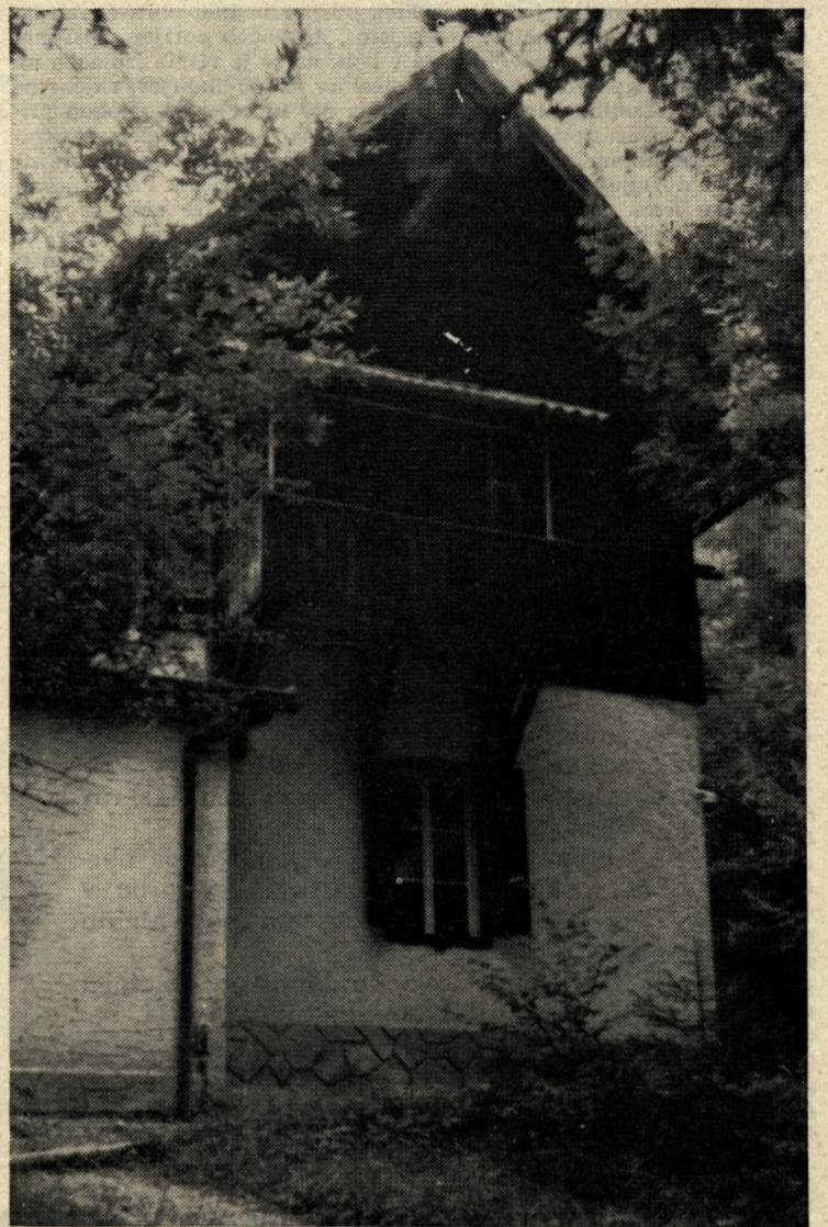
Počitniški dom v Bohinju. Tu bo treba opraviti nekaj popravil, preden bo začela sezona dopustov.