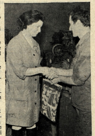
8. marec v tkalnici II