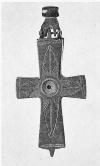
Sl. 58. Krst iz Štrbaca, avers (Nar. Muzej, Beograd)

tu vrstu nimba skrenuo je u poslednje vreme naročitu pažnju profesor A. Grabar, ispitujući slikarstvo Castelseprijia. Profesor Grabar pronašao je zanimljivu činjenicu: u Castelseprijiju i na karolinškim i otoskim minijaturama pojavljuje se neobični krstasti nimb na kome kraci krsta prelaze kružnu konturu nimba. 13 Povodom ove konstatacije Meyer Schapiro potsetio je na slične krstaste nimbove iz poznate Cotton-biblije iz Britanskog muzeja. Profesor Grabar naveo je četiri vrste krstastih nimbova sa kracima koji izlaze iz kruga. U jevanđelistaru sv. Medarda, i njemu sličnim rukopisima, krst sastavljen od trostrukih zraka, ide od Hristove glave i prelazi preko kruga aureole. U Utrehtskom psaltiru isti krst označen je samo jednom linijom. U otoskoj umetnosti krst je naslikan preko površine aureole kao kompaktna masa. Na minijaturama