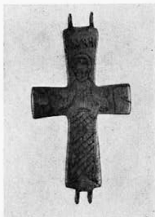
Sl. 60. Krst broj 1125 (Nar. Muzej, Beograd)

jalno nimb na minijaturama salzburške i regensburške škole, koji je identičan nimbu iz Castelseprijia, ipak se iz celog problema ne mogu izlučiti ostale srodne paralele. Pančevački krstasti nimb ubedljivo se vezuje za istočnu ikonografiju i istovremeno svedoči da je on bio, negde u VII ili VIII veku, u upotrebi na predmetima umetničkog zanata verovatno egipatskog porekla.