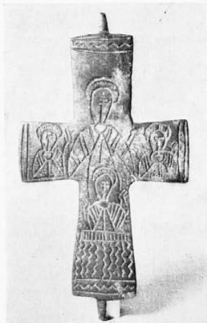
Sl. 65. Krst iz nepoznatog nalazišta, avers (Muzej grada Beograda)

krstu iz Kluža (Barany, 75 a, c) vidi se kakav je bio revers beogradskog krsta iz crkvenog muzeja: stojeća Bogorodica Odigitrija i tri poprsja u gornja tri kraka. Meni se čini da je Mijatev krst br. 49 omaškom odvojio od br. 64; ako bi se kontrolisale mere obe pločice možda bi se pokazalo da one pretstavljaju avers i revers istog krsta-relikvijara.