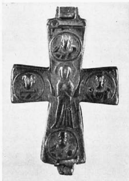
Sl. 52. Krst iz zbirke Lederer, revers

kapele Sancta Sanctorum. 3 Stav raspetoga Hrista sa lako pognutom glavom skoro je identičan na oba krsta; široki četvrtasti izrez na prsima i nabori duge haljine skoro su isti. Tabla u obliku pisma, krstasti završetak gornjeg kraka identični su; na istom mestu nalaze se sunce i mesec — sa tom razlikom što je na vaticanskom krstu sunce zrakasto, a na beogradskom kružnog oblika. Naivno umanjeni likovi Bogorodice i apostola Jovana na beogradskom krstu jako su istrveni. Natpisi ispod horizontalnih krakova krsta na beogradskom primerku nisu naročito čitki, ali se mogu razrešiti. Ispred Bogorodice stoji: \text{I}\alpha\epsilon\upsilon\upsilon\omicron\upsilon\upsilon , ispred Jovana: \text{I}\alpha\epsilon\upsilon\upsilon\omicron\epsilon\varsigma . Majstor je pogreškom stavio dva puta isti tekst: \text{I}\delta\epsilon\ \delta\ \nu\iota\delta\varsigma\ \sigma\upsilon\upsilon . . . (Jovan, XIX, 26), mesto da stavi taj tekst samo ispred Bogorodice, a ispred Jovana: \text{I}\delta\epsilon\ \eta\ \mu\acute{\eta}\tau\eta\rho\ \sigma\upsilon\upsilon . . . (Jovan XIX, 27) kao što obično stoji na ostalim krstovima. 4 Isti natpis pojavljuje se i na ikonografski mladim ikonama Raspeća sa obnaženim Hristom; naprimer, na sinajskoj ikoni koju Sotiriu publikuje na tabli XXVI. 5