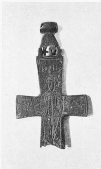
Sl. 57. Krst iz Štrbaca, revers (Nar. Muzej, Beograd)

Veoma zanimljiv krst sa ugraviranim crtežima nalazi se u pančevačkom muzeju; on je publikovan već 1941 godine. 12 Očuvana je samo prednja strana na kojoj je predstavljena Bogorodica sa Hristom; Bogorodica je signirana iznad glave kao: nanaria (sl. 53). V. Mošin je već ukazao na sličnost ovog primerka sa jednim krstom iz Lenjingradskog Ermitaža. Jedan detalj na pančevačkom krstu naročito je dragocen: krstasti nimb malog Hrista na kome krakovi krsta izlaze iz aureole. Na