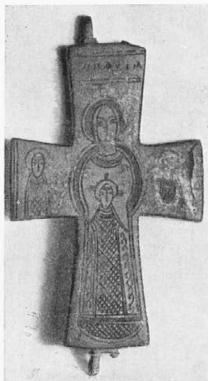
Sl. 53. Krst Gradskog muzeja u Pančevu

Na reversu istog beogradskog krsta u sredini je reljef stojeće Bogorodice-Orante. U kracima krsta smešteni su medaljoni sa poprsjima jevanđelista; na gornja tri kraka dobro se raspoznaju: pored Mateja \text{M} , pored Luke \Delta i pored Jovana I; donje \text{M} , uz Marka, kao da nije ni bilo ugravirano. Oba reljefa na aversu i reversu, zajednički se često pojavljuju na krstovima ovog tipa. Kao najbliže paralele navodim dva krsta iz Sofiskog muzeja, brojeve 54 i 55 — po numeraciji Mijateva. Bugarskim