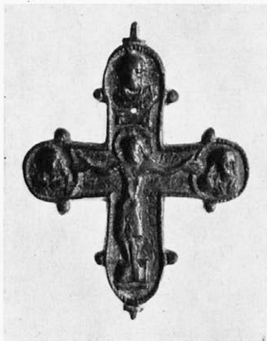
Sl. 59. Krst, avers (Crkveni Muzej, Beograd)

salzburške i regensburške škole i u Castelsepriu krst liči na krstove Utrehtskog psaltira, samo su jednostavnije linije na kraju završene kratkom crticom, kao glave eksera (»têtes de clou«). Krstasti nimb pančevačkog krsta-relikvijara predstavlja petu varijantu krstastog nimba sa kracima koji se pružaju izvan kruga: sam nimb je shvaćen kao čvrsta masa iz koje, ili iza koje, izbijaju trostruki zraci krsta. Iako je profesor Grabar u odgovoru Meyer-u Schapiro podvukao da njega zanima speci-