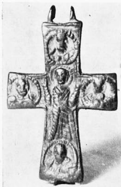
Sl. 62. Krst iz nepoznatog nalazišta, revers (Muzej grada Beograda)

gestovi Bogorodice i sv. Jovana skoro su identični, oboje se jednom rukom hvataju za glavu, dok drugu pružaju prema Hristu. Desno uz Hristovo telo vertikalno je ispisano: \phi \alpha\rho\eta\sigma . Krsto Mijatev, koji je publikovao jedan krst iz istog kalupa, ispravlja natpis u: \phi \alpha\rho\eta\sigma i čita dalje: \omega\omega kod Bogorodice \mu\theta \Theta\nu i, uz gornji medaljon: \mu\mu 15 Barany-eva donosi na tabli 75 dva primerka koja su skoro identična sa sofiskim i beogradskim. U zbirci A. S. Uvarova postojalo je dvadesetak sličnih krstova, nažalost nedatiranih i bez podataka o poreklu. 16 Na očuvanom