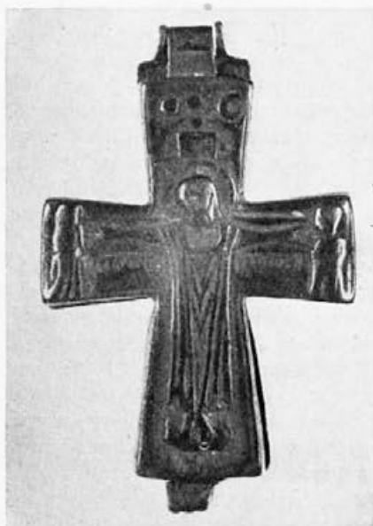
Sl. 51. Krst iz zbirke Lederer, avers

Beogradski krstovi samo po svom opštem tipu pripadaju vrsti krstova-relikvijara, ali se oni međusobno znatno razlikuju hronološki, stilski i ikonografski. Kao najstariji i stilski veoma čisti primerci ističu se dva krsta. Prvi, iz privatne zbirke Lederer, pronađen u južnom delu Srbije, dobro je očuvan, ima obe strane: na licu raspetoga Hrista u kolobionu, na naličju Bogorodicu-Orantu i četiri medaljona sa poprsjima jevanđelista (sl. 51, 52). Krst je visok 8,9 sm., širok 5,5 sm.; ozleđen je neznatno na reversu dole, ispod medaljona jevanđeliste Marka. Reljef na licu jako potseća na reljef poznatog zlatnog krsta iz vaticanske riznice