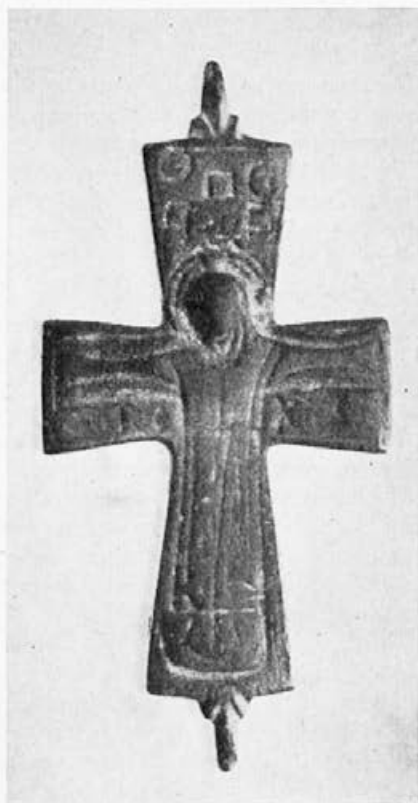
Sl. 54. Krst iz Ljubičevca kod Kladova (Nar. Muzej, Beograd)

krstovima sasvim su bliski i po načinu izrade naličja krstova koje Barany-eva publikuje pod brojevima 61 i 63 c. Ako se beogradski krst uporedi sa navedenim bugarskim i ugarskim paralelama upada odmah u oči, da je beogradski primerak znatno viših umetničkih kvaliteta. Krupni potezi i sigurno modelovanje odaju ruku rutiniranog zanatlije; orijentalno poreklo ovog primerka očividno je. Beogradski krst više deluje sirski nego i spomenuti zlatni vatikanski krst koji na reversu ima mesto Orante Odigitriju. Kao i većina ovog materijala, ni beogradski krst iz zbirke Lederer ne može se precizno datirati. Sudeći prema najslič-