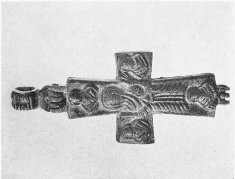
Sl. 56. Krst broj 2121, revers (Nar. Muzej, Beograd)