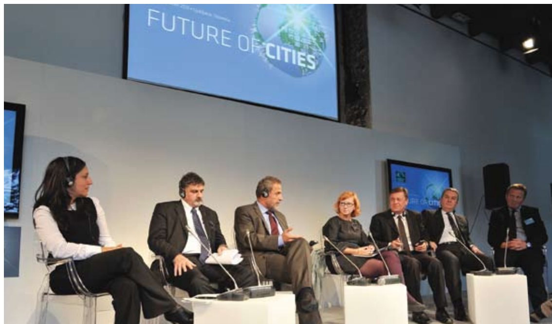
PETER IRMAN / VISION

Poleg strokovnih pogledov o metodi previdevanja kot eni najučinkovitejših znanstvenih metod za upravljanje mest v prihodnosti so bili med najbolj zanimivimi vsebinami konference zagotovo primeri dobrih praks. Med njimi je izstopal Dunaj, eno od