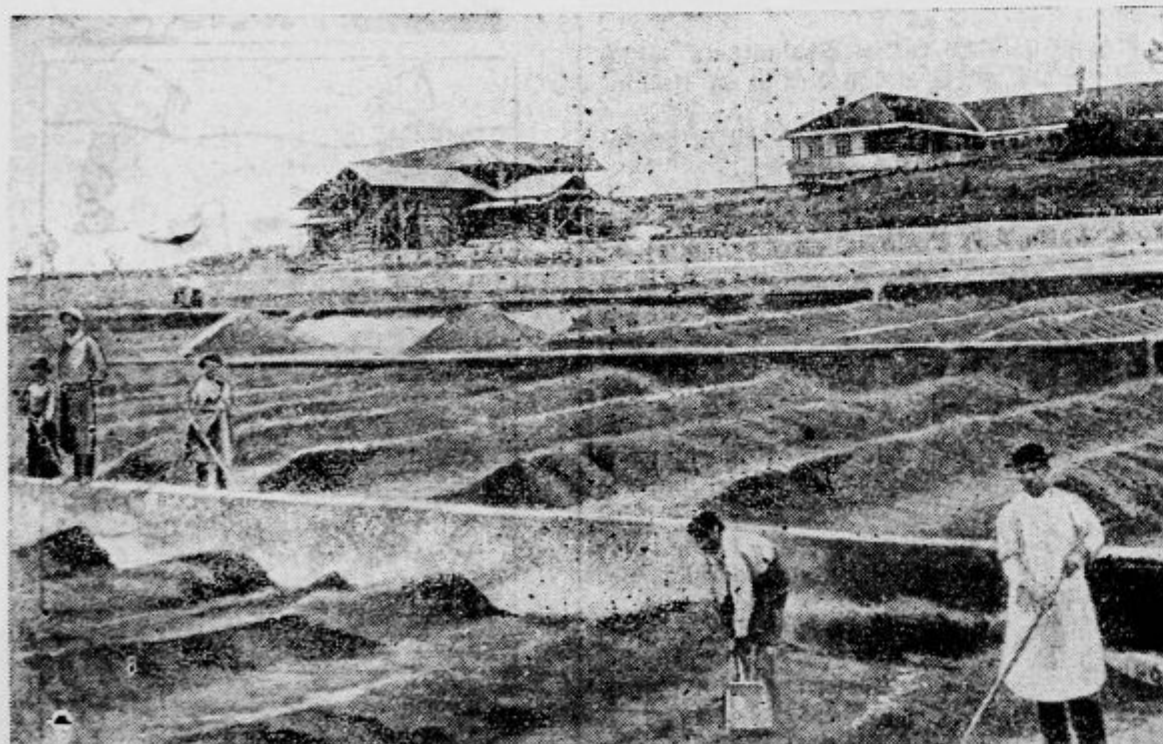
Na obsežnih plantažah suše kavovčevo zrnje

»Postoj, Franci!« pravi žena. »Samo to mi povej. Ali morda vprašuješ, kje sem bila iz bojazni, ker imaš slabo vest? Kar povem ti. Videla sem te z ono, torej sem te zalotila. Nič ne taj! In ti si iskal prilik- ke, da bi jaz storila to, kar si storil ti. No, sedaj pojd, čeprav k oni, a otrok ostane pri meni.« Možu je zmanjkalo besedi, lice se mu je zjasnilo, jeza v njem se je polegla. »Žena, ti si pa vrag! Premagan sem. Vse je res. Pa ostanem pri vaju.« Nič drugega ni spravlil iz sebe. Segel je po meni in si ob meni pomiril živce... No, sem si mislil, tam idila, tukaj pre- pir.