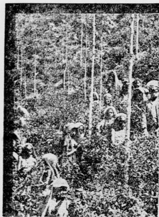
Pri žetvi čaja

V resnici smo bili že precej razvajeni. Za zajtrk smo hoteli piti kakao, po vsakem obedu in tudi ob drugih prilikah črno kavo, zelo v navadi pa je bil tudi že popoldanski čaj. Danes smo od dobaviteljev: Brazilije, Afrike in Indije odrezani, v Evropi pa te nenavadno nežne rastline ne morejo uspevati. Prej so izhajali tudi brez njih, saj je preteklo komaj 300 let, odkar so jih našli predniki spoznali, in šele kakih 200 let je minilo, odkar so več ali manj postala ljudska pijača. V začetku so si te kolonialne dragocenosti lahko privoščili le dobro situirani ljudje.