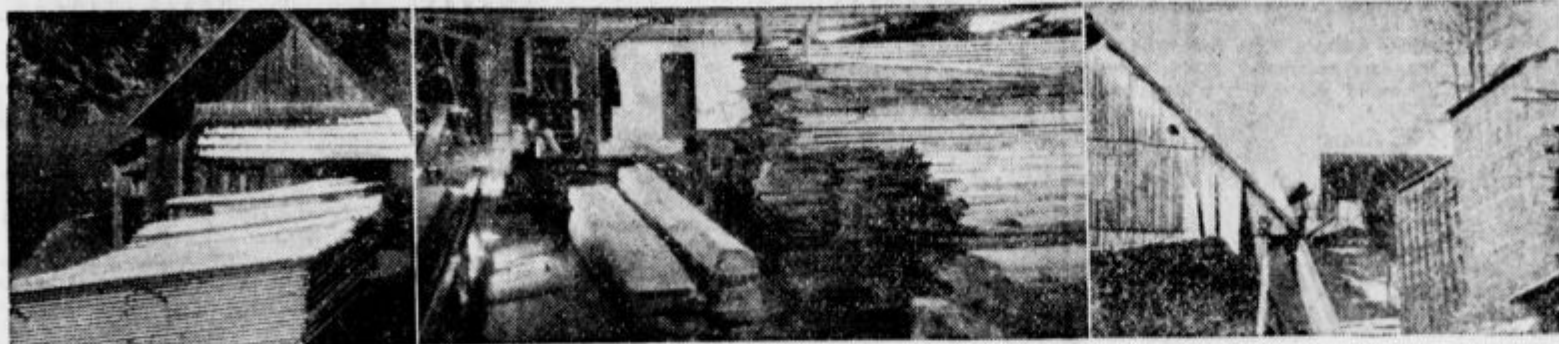
Ustavljene žage, polna skladišča lesa - to so posledice sankcij v naši lesni industriji in trgovini

Uprava: Koprarjeva ulica št. 6 Poštni ček račun Ljubljana 15.179. Telefon št. 2992