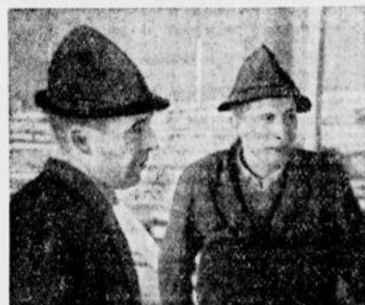
Dva izmed 10.000 brezposelnih slovenskih lesnih delavcev.