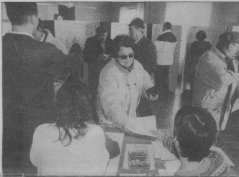
Volišče 119 v Polju v nedeljo, 4. 12. '94

Glasovi so torej razdeljeni, toda vprašanje, kdo bo v Ljubljani na oblasti, je še vedno odprto. Vaši domisljaji, dragi bralci, prepuščam, da sku-