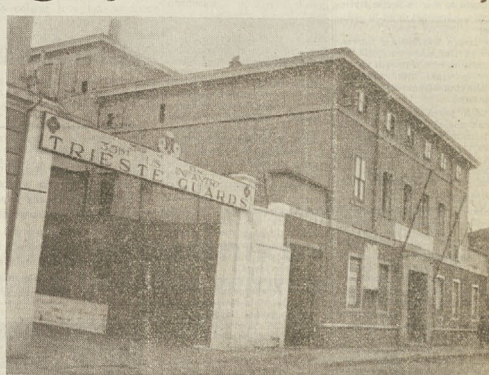
Vrnili se bomo v svoj dom... Triest barracks.