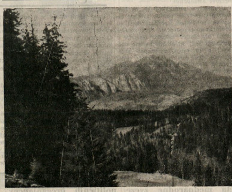
Razen drugih daril bodo te hribe v demokracični rumunski deželi obiskali naši zmagovalci pri tekmovalju za širjenje demokracičnega tiska.

Kolo zgodovine se kljub inkvizicijam in izobčenjem nikoli ni ustavilo, marveč je krožilo naprej. In tako travi tudi sedaj. Ne morejo ga ustaviti niti groznje s peklom, z izobčenjem in niti z atomsko ali vodikovo bombo.