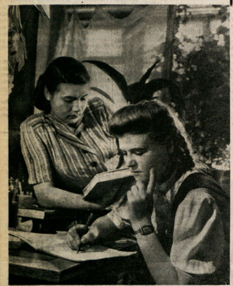
Mladina Sovjetske zveze živi v popolni svobodi pri delu in učenju, dočim mladina Jugoslavije še vedno organizira stavke zaradi nevezdržnega izkoriščanja in življenjskega stanja.

Kakšni so življenjski pogoji delovne mladine, je najboljši dokaz nečloveško postopanje z učenci kmetijskih šol. Oni bivajo v nečloveških prostorih, brez oken in postelj, spijo pa na golih deskah brez pokrivala. Isto se dogaja z učenci v vojne oblasti v Zagrebu. Razen tega so učenci primorani delati vsakodnevno 4 - 5 ur nadurnega dela, hrana pa je slaba in nezadostna. Zaradi takih suženjskih pogojev življenja in dela, obolevajo učenci v vedno večjem številu.