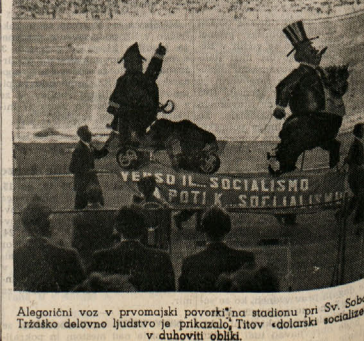
Alegorični voz v prvomajski povorki na stadionu pri Sv. Soboti. Tržaško delovno ljudstvo je prikazalo, Titov »dolarski socializem« v duhoviti obliki.