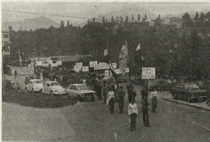
Takole zbrani smo odšli na prizorišče proslave 40. obletnice tekstilne stavke, ki je bila prav tako v prostorih Gorenjskega sejma

Naslednji dan so bila organizirana pogajanja med delavci in delodajalci, ki so obljubljali, da se bodo začela pogajanja, če delavci zapustijo tovarne. Vodstvo stavke pa je vztrajalo na svojih stališčih in stavka se je nadaljevala in tedanja oblast je spoznala, da stavkujočih ne bo mogla zlomiti, še posebej za-