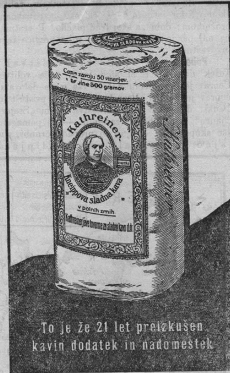
To je že 21 let preizkušen kavin dodatek in nadomestek