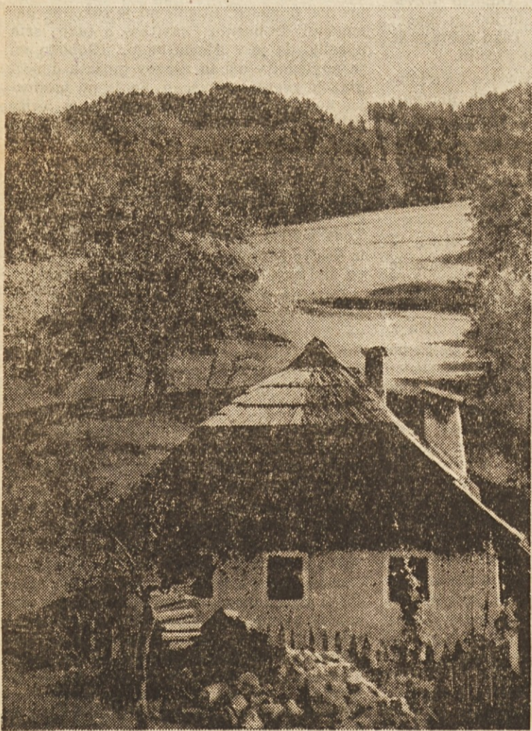
Vse hiše v Selah so izrazito slovenskega značaja

Ravnatelj: »In jaz vam dam 20.000 dolarjev, če ponudbo sprejmete.«