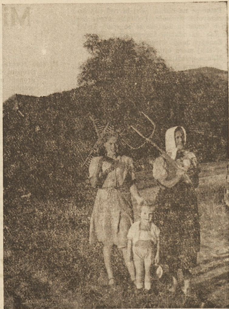
Po končanem delu se vrača vesela družina domov