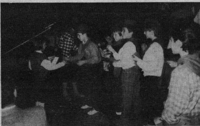
Vesetje in zanos je videti na mladih obrazih ob slovesnosti sprejemanja v pionirsko organizacijo. Takšen prizor je posnela kamera v Mozirju.