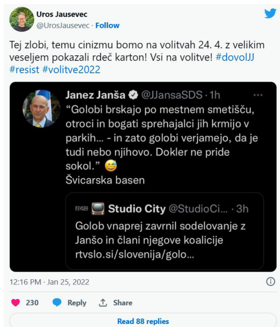
Slika 1: Odziv Janeza Janše na Twitterju po nastopu političnega konkurenta v Studiu City