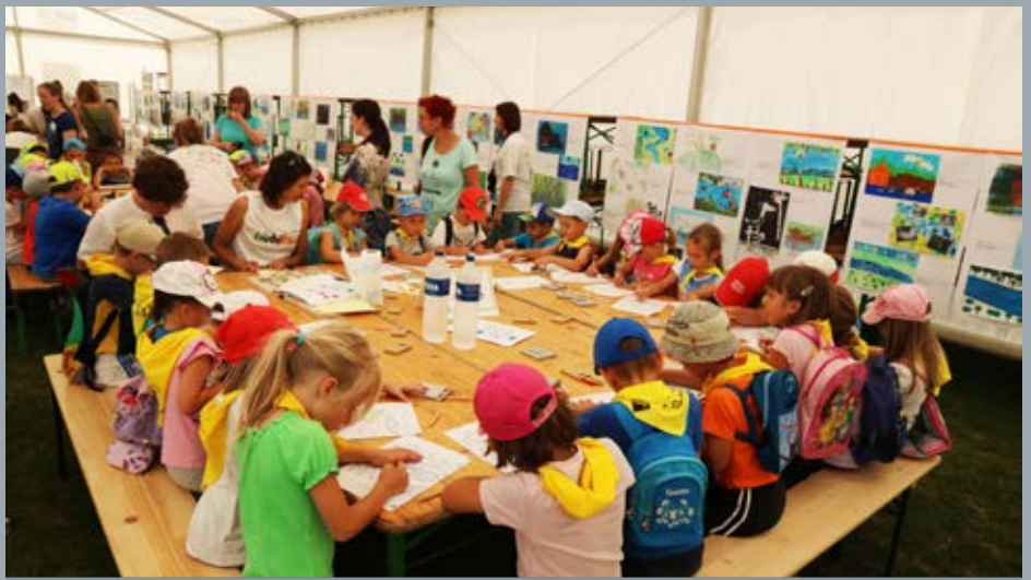
Delavnica za otroke na prireditvi 24 ur z reko Muro, ki jo je v Veržeju organizirala mariborska enota Zavoda RS za varstvo narave in k njeni izvedbi povabila vrsto NVO ter strokovnjakov, med njimi tudi DPRS. (foto: Neža Posnjak, 12. VI. 2015)

Toliko medijskih objav je zasluga izjemne ženske, ki je novinarka in je zelo pomembno ojačala naše obveščanje javnosti. Zagotovo lahko trdim, da je prva prava naravovarstvena novinarka v Sloveniji. Seveda pa lobiji še vedno obvladujejo medijski prostor, kot sem že omenila. Mediji ustvarjajo heroje in poražence ter se aktivno trudijo očrtniti DPRS in stališča, ki jih zagovarjamo, kakšne naše uspehe pa celo pripišejo drugim. Naše aktivno delovanje v pravnih postopkih pa je tisto, kar prisili medije, da objavijo naše dosežke. Ti imajo, kot že rečeno, zmeraj širok pomen za varstvo narave v Sloveniji in velik vpliv na spoštovanje tako domače kot za-