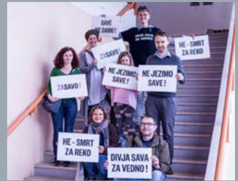
Protestna akcija ozaveščanja na podjetniškem srečanju v Litiji leta 2018 v organizaciji časopisa Finance, kjer so se med drugim spraševali, »kaj prinašajo Litiji elektrarne na srednji Savi«.

ANOVE je vseboval samo dve varianti pridobivanja OVE in obe varianti sta vključevali maksimalno izrabo naših rek, kar pomeni, da je bila vključena tudi gradnja