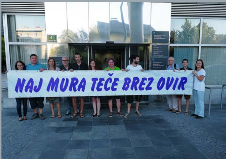
DPRS je na javni razgrnitvi Akcijskega načrta za obnovljive vire energije 2010–2020 (ANOVE) , 19. IX. 2017, zahtevalo razglasitev izključitvenih območij za ribe, znotraj katerih HE ne bi bilo dovoljeno graditi.

V DPRS bomo še naprej nadaljevali svoje poslanstvo, brez popuščanja, za prostotekoče reke, varstvo rib in njihovih habitatov. Ker v DPRS verjamemo v pravno dr-