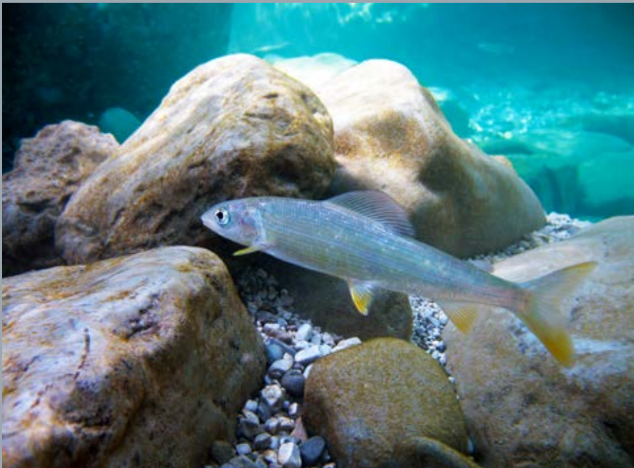
Enega od sloganov DPRS – Ribe in njihovi habitati ne morejo govoriti, zato smo dolžni mi in bomo! – krasi lipan ( Thymallus thymallus) na sliki.

Zatajili so uradniki, ki delajo v službi varstva narave in so odgovorni za izvajanje naravovarstvene zakonodaje, tako prvenstveno MOP in ARSO. Upravno sodišče v svojih razsodbah redno opozarja na številne postopkovne in vsebinske nepravilnosti. Ugotavlja tudi, da že samo zaradi ugotovljenih pomanjkljivosti pri upoštevanju pravil postopka izpodbijanih odločb ni mogoče potrditi kot pravilnih in zakonitih. In zatajili so politični predstavniki, ki se postavljajo nad zakonodajo ali jo prilagajajo svojim potrebam ter osebnim interesom (npr. Vizjak pri HE Mokrice s spremembo ZON in gradbene zakonodaje ter sprejemom protikoronskih ukrepov).