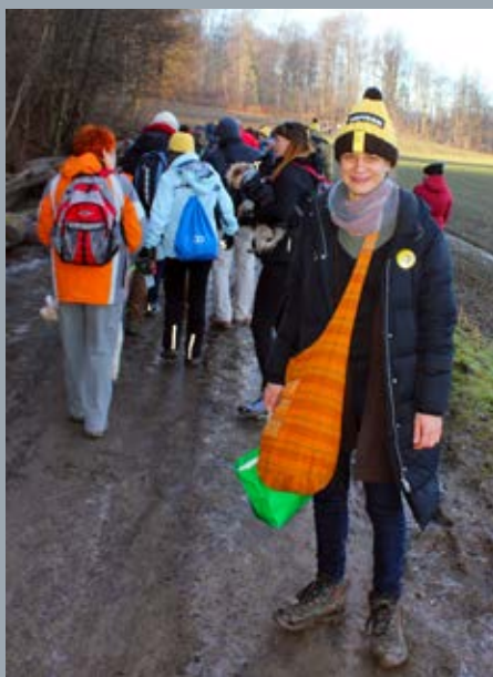
Na Maršu za Muro v organizaciji Zavoda Muzej narosti, Trate.

Dostop do pravnega varstva obstaja, a terja veliko znanja in angažmaja. Upravno sodišče odlično opravlja svoje delo in se v vsako tožbo poglubi, vendar pa mora biti gradivo zelo dobro pripravljeno in argumentirano. Razsodbe so izjemnega pomena, in to veliko širše kot v konkretni zadevi, saj uradnikom v upravnih postopkih dajejo navodila za izvajanje zakonodaje