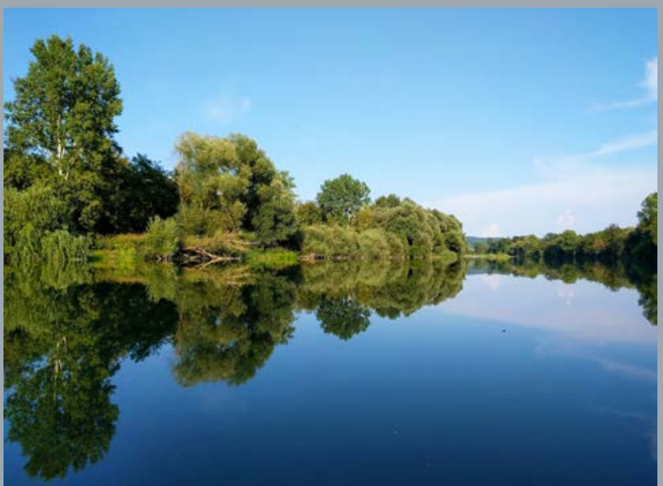
Reka Drava pri Dupleku. (foto: Barbara Zakšek, 19. VIII. 2018)

konodaje EU in boljše vodenje povezanih postopkov.