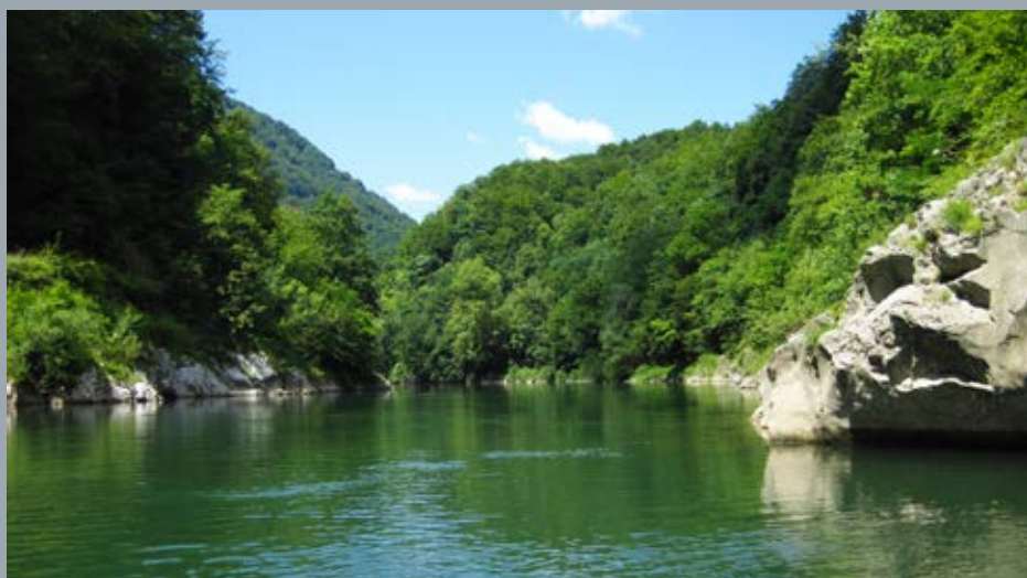
Sava med Hrastnikom in Zidanim Mostom. (20. VII. 2020)

Četudi bi pri nas zgradili vse načrtovane HE, ne bomo mogli nadomestiti Termoelektrarne Šoštanj ali jedrske elektrarne, ki vsaka proizvedeta približno po tretjino elektrike. Imamo 22 velikih in 500 malih HE, od tega 9 HE na Dravi proizvede 70 % vse hidroenergije.