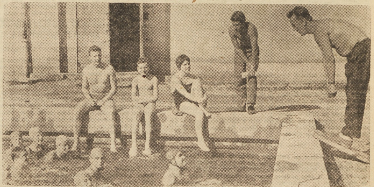
Pogovor ob bazenu? Da. Tudi takšni pomemki, potem ko so plavalci že »požrl« precej kilogramov v vodi, so zelo koristni

ke s starši, le-ti pa so z delom v našem klubu zelo zadovoljni. Običajno kar sami pripeljejo otroke v klub, da bi jih vključili v naše tekmovalne vrste. Seveda morajo ti otroci skozi »sitot« v plavalni šoli in nadaljevalnem tečaju. Sicer pa je vzgoja v našem klubu nasploh na dostojni višini. Če je nekdo med mladinci slab dijak, ne sme na treninge, dokler ne popravi ocene. Na drugi strani moramo zatrditi, da nihče od aktivnih plavalcev ne kaži, čeprav nanje nismo gledali tega