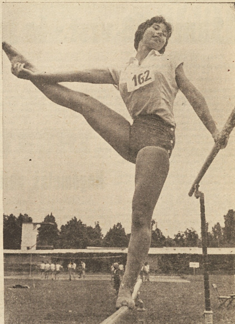
Na današnjem republiškem prvenstvu v partizanskem mnogoboju, ki je obsegal predvsem atletske discipline, kakor tudi razne vaje na orodjih in osnovno znanje v raznih športnih igrah, je bila udeležba, žal, zelo skromna

Današnja igra jugoslovanske reprezentance ni bila biesteča. Lahko bi rekli, da so Jugoslavnici pokazali