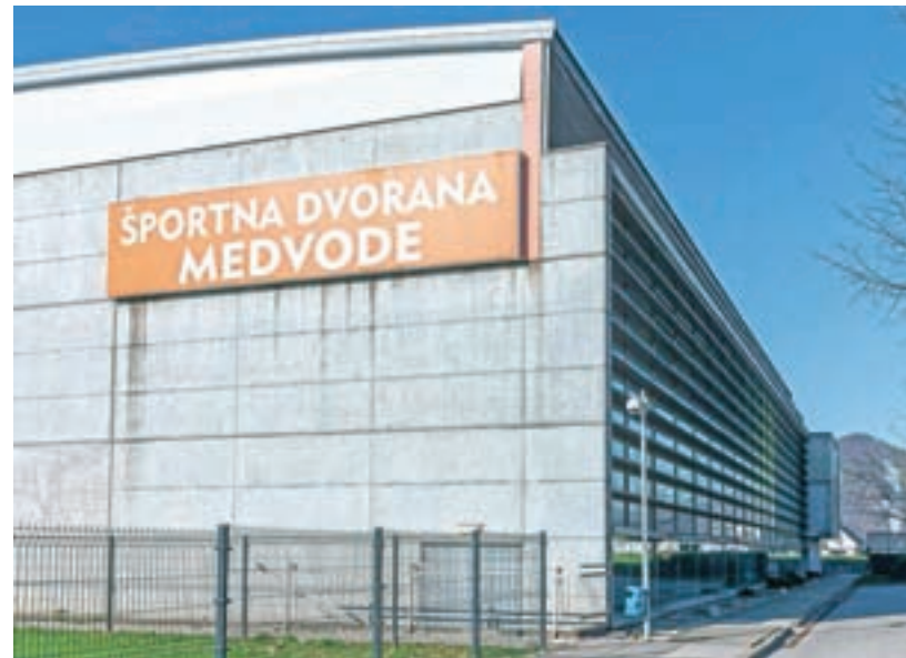
V Športni dvorani Medvode so odpovedane vse prireditve zunanjih organizatorjev do konca šolskega leta.

Na področju kulture smo predstavili dve gledališki predstavi abonmaja Sotočje, za nadomestne termine se še usklajujemo z izvajalci, podobno velja za glasbene večere Glasba za poku-