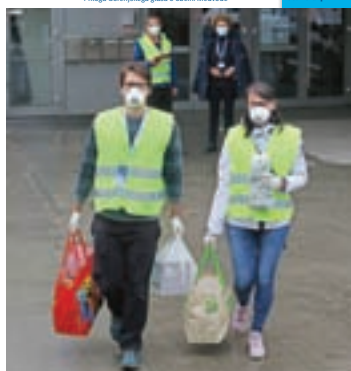
Na naslovnici: Prostovoljci Centra kriznega odziva Občine Medvode