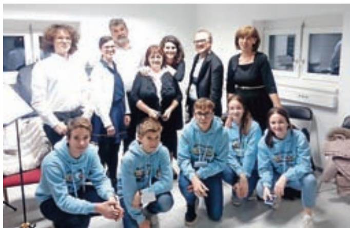
Na 21. Mednarodnem festivalu ustnih harmonik v Mokronogu so tako Sorški orgličarji kot Sorške face, oboji delujejo pod okriljem KUD Oton Župančič Sora, prejeli zlato priznanje. M. B.