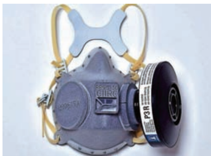
Respirator, narejen s 3D-tiskalnikom

V češki Škodi pa so za izdelavo respiratorjev uporabili kar 3D-tiskalnike. Respirator je narejen iz homogenega in neporoznega poliamidnega materiala, kar je ključnega pomena za možnost kasnejše dezinfekcije respiratorja. Narejen je za večkratno uporabo in je v prvi vrsti namenjen zdravnikom in drugim najbolj izpostavljenim poklicem. Tudi pri Škodi je ves postopek od začetka razvoja do certificiranja respiratorja in vzpostavitve proizvodnje trajal zgolj teden dni. Tiskalnik lahko sestavne dele natisne za šestdeset respiratorjev naenkrat. Eno tiskanje traja 16 ur, sledi faza ohlajanja, ki traja približno enako dolgo. Sestavne dele dostavijo podjetju