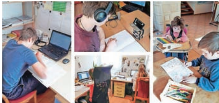
Del vsakdana družine Jezeršek v času koronavirusa

Učitelji imajo različne načine poučevanja na daljavo. "V OŠ Preska so navodila za delo podana v spletni učilnici. Dobro je, ker je za vsak predmet po tednih in dnevih zapisano, kaj je treba narediti, tako da lahko pregleduješ za nazaj. Vsak učitelj ima svoj način. Nekateri napišejo