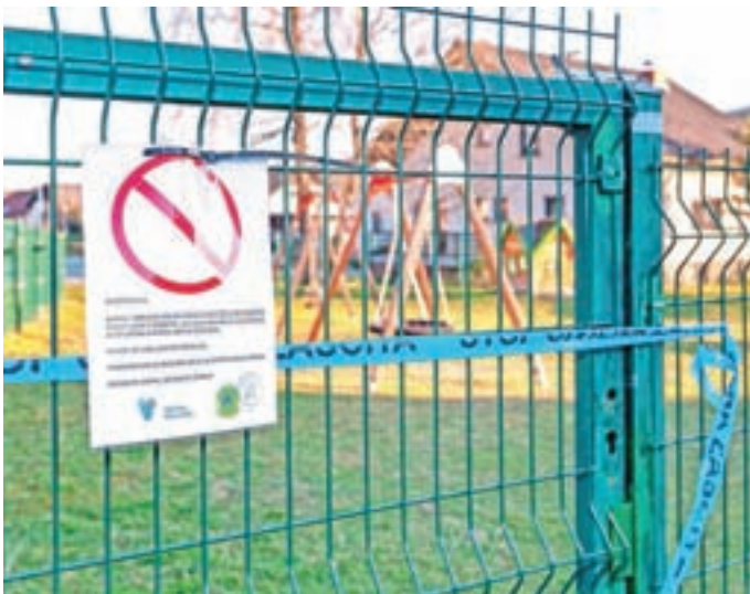
Zaprta so tudi vsa otroška in športna igrišča.

Kaj vse so med drugim še uvedli? Za otroke staršev, ki so v tem času nepogrešljivi na delovnem mestu, je na voljo nujno varstvo otrok na domu. Pogodbeniki Civilne zaščite in prostovoljna gasilska društva so z 29. marcem začeli izvajati razkuževanje in čiščenje površin okrog najbolj izpostavljenih točk (trgovine, pošta, banka, lekarna, zdravstveni dom ...). Podjetje Telekom Slovenije nadaljuje gradnjo optičnega omrežja. Občina Medvode jim je izdala navodila, da gradnja v tem času lahko poteka le po cestah in drugih javnih površinah, zaradi preprečevanja širjenja koronavirusa pa do nadaljnega ne bodo izvajali gradenj hišnih priključkov, pri katerih bi bil potreben stik z občani.