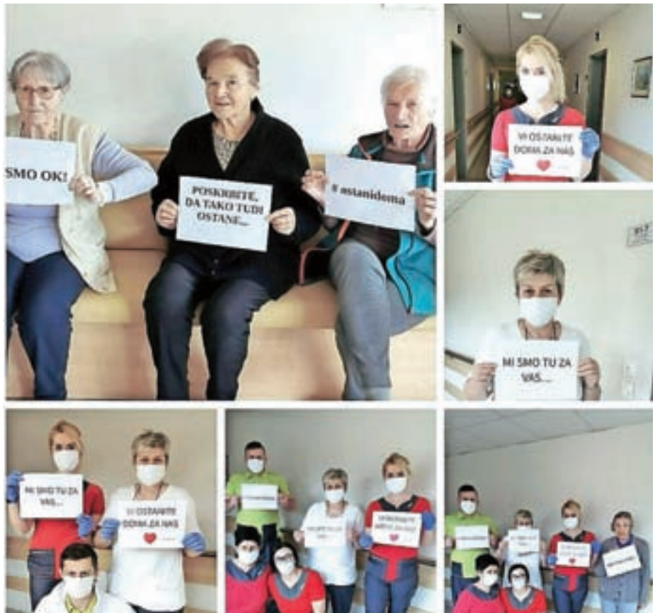
V Centru starejših Medvode je skoraj dvesto stanovalcev in več kot sto zaposlenih. Tudi oni sporočajo, da ostanite doma.

»Vse sile smo usmerili v pogovore s stanovalci, tako da jih poskusimo zamotiti in jih odvrniti od razmišljanja o tej situaciji.«