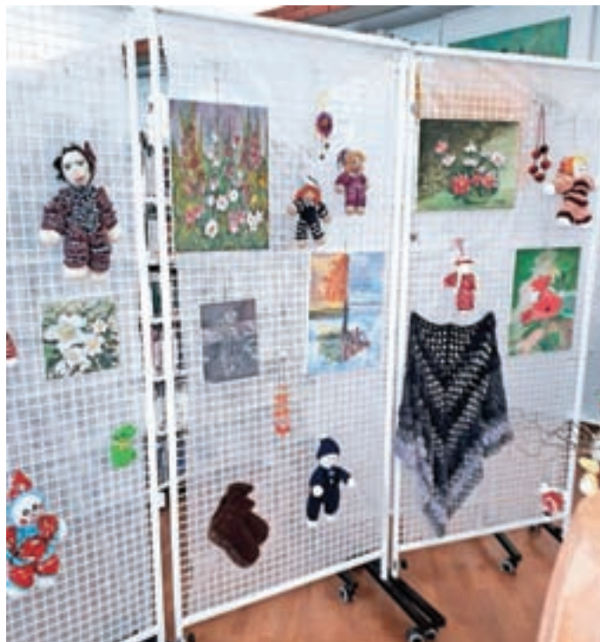
Razstava skupine za ročna dela Društva upokojencev Medvode v medvoški knjižnici

bivajo se vsak torek. Tako je že več kot trideset let. Enkrat mesečno imajo delavnico na izbrano temo.