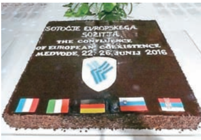
Pred štirimi leti so Medvode že bile gostitelj srečanja prijateljskih mest.

Tudi mednarodna dejavnost občine ne miruje. Tako smo v začetku septembra že povabljeni na praznovanje petdesetletnice občine Nidda, prav tako bodo v francoskem mestu Crest jeseni svečano odprli oziroma poimenovali enega od svojih trgov v trg Medvode.