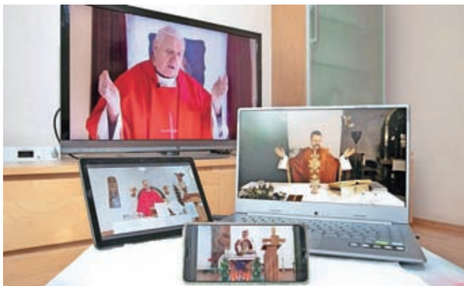
Pri sveti maši iz medvoških župnij: v prenosu TV Medvode ali na družbenih omrežjih