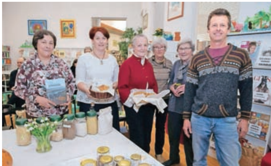
Na domoznanskem večeru Sorško polje, kdo bo tebe ljubil, če bom jaz ob strani stal? so se predstavili člani Društva Sorško polje.

vzpostavilo tudi skupna ekološka, biodinamična in permakulturna vrtova, katerih namen je pridobivanje praktičnega znanja o ekološkem, biodinamičnem in permakulturnem načinu vrtnarjenja. "Način pridelave hrane, imenovan permakultura, ki se pri nas pojavlja bolj poredko, ne pozna klasične obdelave tal, le na začetku je nujno potrebno rahljanje in zastiranje, ki omogoča tvorbo humusa. Pridelki sodijo v naravno hrano, nimajo pa posebne oznake," je pojasnil Jerala in nadaljeval: "Ideja skupnih vrtov je, da bi jih domačini vzeli za svoje in da bi jim predstavljali prostor, kjer bi se družili, izmenjevali izkušnje in razmnoževali domača semena."