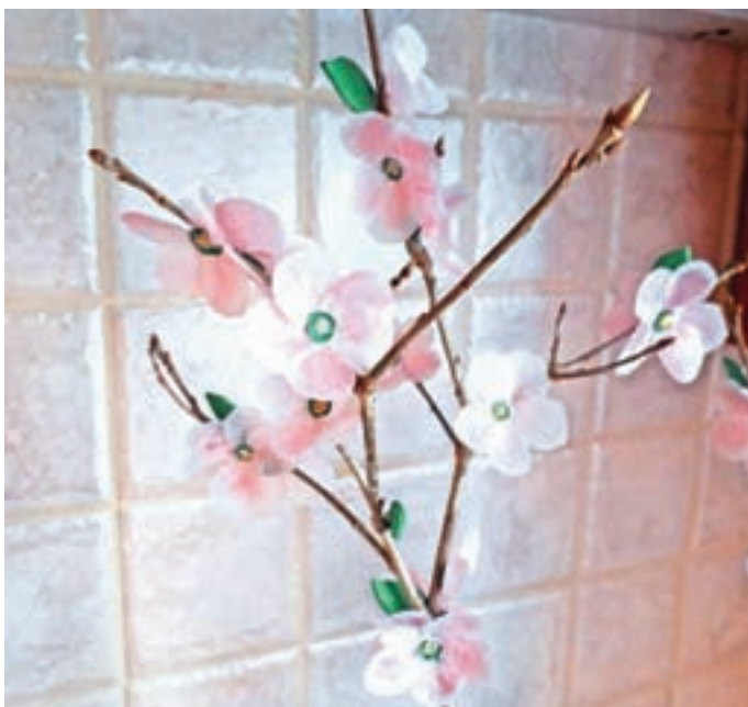
Češnjevi cvetovi iz paus papirja