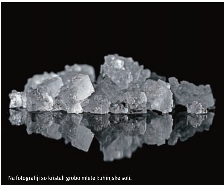
Na fotografiji so kristali grobo mlete kuhinjske soli.

Ker smo po veliki noči, lahko pobrskamo v hladilniku, kaj nam je ostalo od praznikov in predelamo. Sveži hren naribamo in dodamo jajca in jabolko. Če še vedno ostaja suho meso, ga narežemo na kocke in skuhamo ričet. Moj ričet je hitro pripravljen. Narežem na kocke krompir, korenje, suho meso. V vodi operem ješprenj in ga dam kuhat v večjo posodo. Dodam narezane sestavine, začimim z domačo vegeto, dodam suh česen v zrnju (tega pri meni ne sme zmanjkati), 3 velike žlice ocvrte čebule (se čudovito razpusti v vodi in ni sledi po čebuli za tiste, ki je ne marajo), malo peteršilja, 1 konzervo rjavega fižola, začimbe po želji, ne smeta manjkati lovorjev list in poper v zrnju. Solim na koncu. Jajca porabimo na regratovi solati oziroma katerikoli solati, lahko pa naredimo tudi jajčno solato. Jajca olupimo in narežemo na rezine, dodamo čebulo, solimo, dodamo olje in kis. Dober tek vam želim in ostanite zdravi!