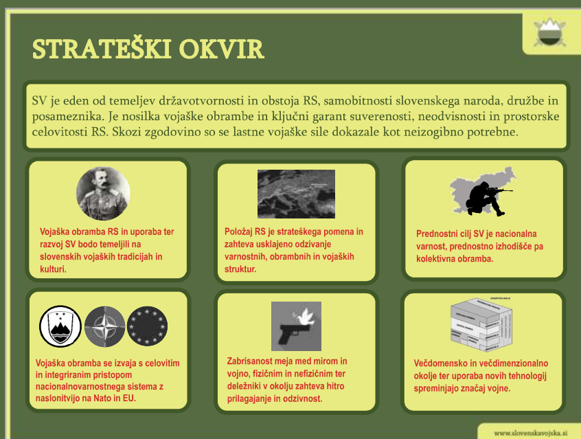
▼ Shema 2: Strateški okvir