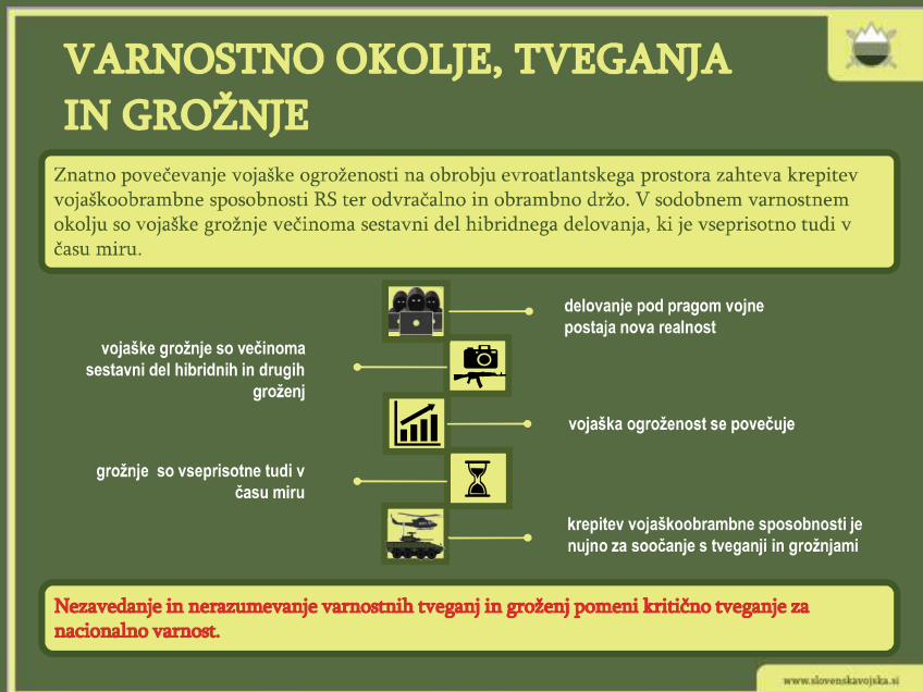
▲ Shema 3: Varnostno okolje, tveganja in grožnje