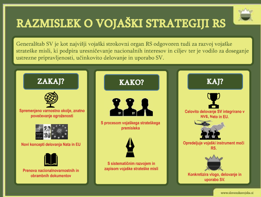
▲ Shema 1: Razmislek o vojaški strategiji Republike Slovenije

Pred nami je najzahtevnejši del vsakega procesa – implementacija napisanega. S tem imamo v Sloveniji največ težav. Glede na razmere v svetu lahko implementacija določil strategije pomeni razliko med življenjem in smrtjo, med obstojem in zatonom. Verjamem, da nam bo uspelo. Ampak le, če bomo ENOTNI.