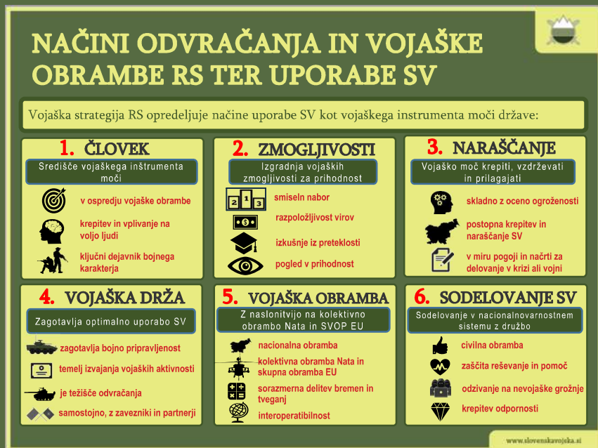
▲ Shema 6: Načini odvrtačanja in vojaške obrambe Republike Slovenije ter uporabe Slovenske vojske