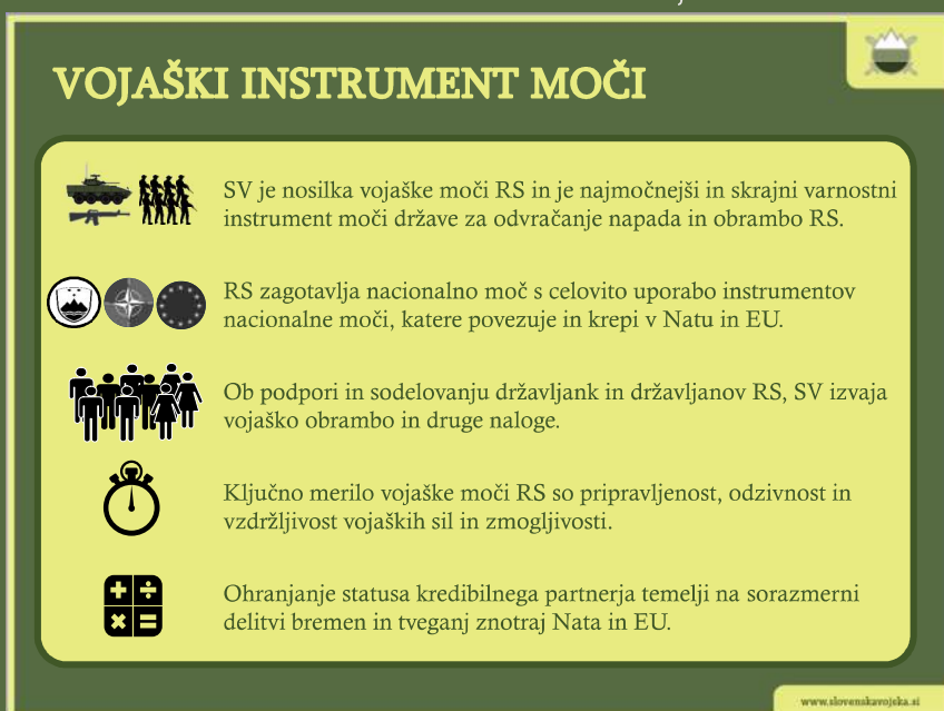
▼ Shema 5: Vojaški instrument moči