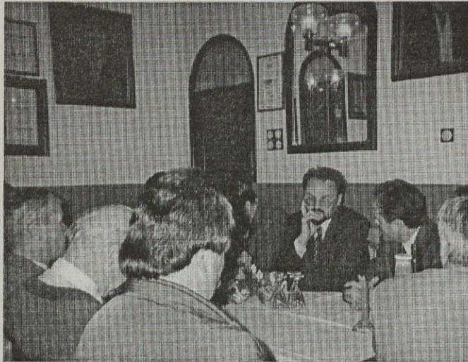
Kacin je prišel tudi v Šentjur

so ga presenetili na Prevorju, kjer so napolnili dvorano v gasilskem domu.