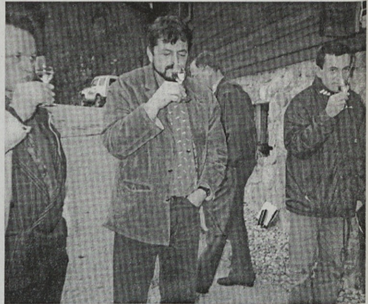
Mhmm, bolje kot čisti kisik

jeseni, kar daje vinu posebne značilnosti: relativno nizko kislino, ekstrakt in alkohol sta visoka, ostanek nepovretega sladkorja zgladi okus, cvetica je zelo nežna. Za res vrhunsko kvaliteto je treba včasih trgati še posebej pazljivo in preprosto s poizkušnjo jagod ločiti dobre grozde od slabih. Pojavljajo se tudi razlike med spodnjim in zgornjim delom vinograda (v vročem letu je spodnji del boljši in obratno).