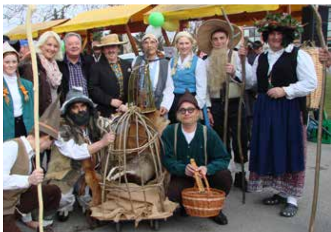
Prvo mesto: Kekčeva družina – denarna in praktična nagrada – člani KTD Male rjitar Tešanovci