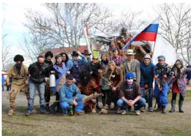
Tretje mesto: člani društva Selenca Ivanci – Kmečki živelj, praljudje in Hanibal