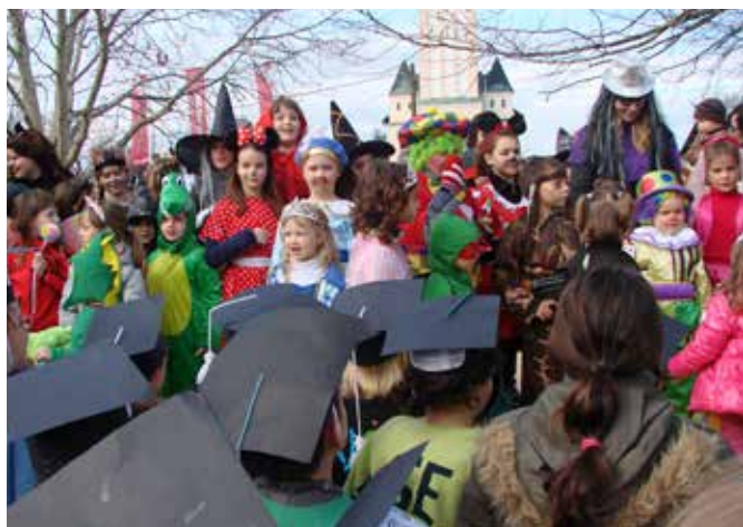
Drugo mesto: Unesco šola – OŠ Fokovci, edini prisotni predstavniki vzgojnih zavodov iz občine