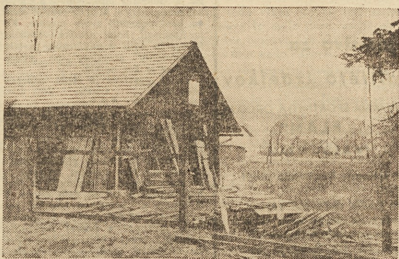
Skladništvo pri Odpadu? Ne, marveč čolnarna Savice, ki jo je že res temeljito načel zob časa