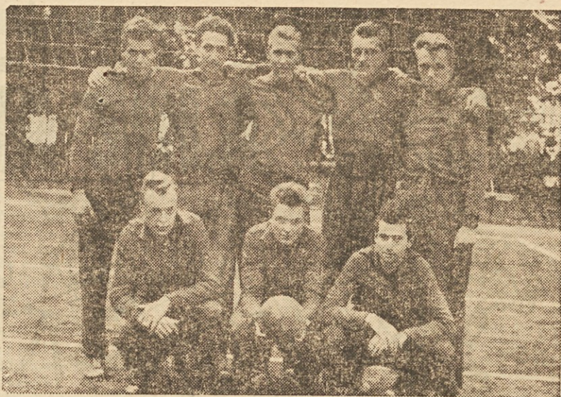
Moštvo Fužinarja iz Raven, novi član zvezne moške odbojgarske lige