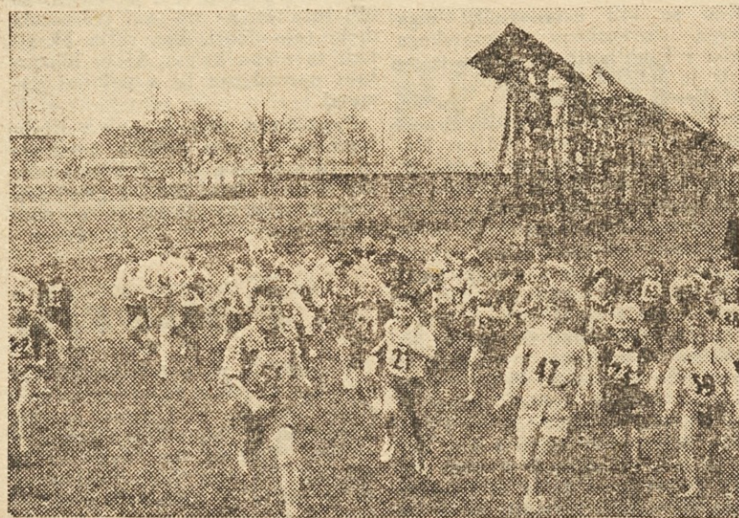
Na krosu ni samo dovolj svežega zraka in sonca, ampak je lahko tudi veselo in prav prijetno.