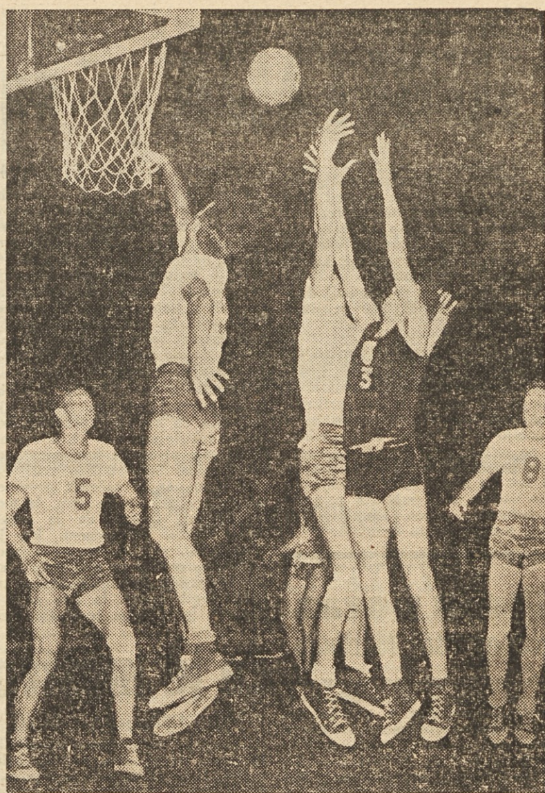
Včeraj so se pričele prve tekme spomladanskega dela zvezne moške košarkarske lige, ki so spet privabile na košarkarska igrišča na tisoče ljubiteljev tega športa. Prihodno nedeljo bo imela Ljubljana spet dohodek prvega reda: lanski državni prvak, osiješki Proleter, se bo pomeril z moštvom Olimpije!