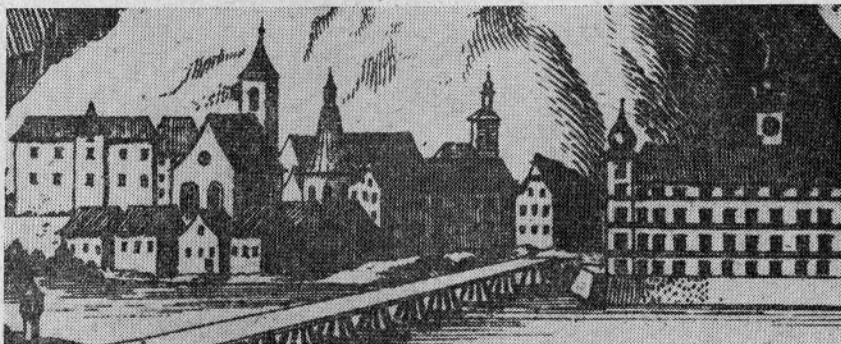
SLIKA LAŠKEGA IZ LETA 1681 — LEVO OD MOSTA VIDIMO ŠPITAL S ŠPITALSKO CERKVIJO