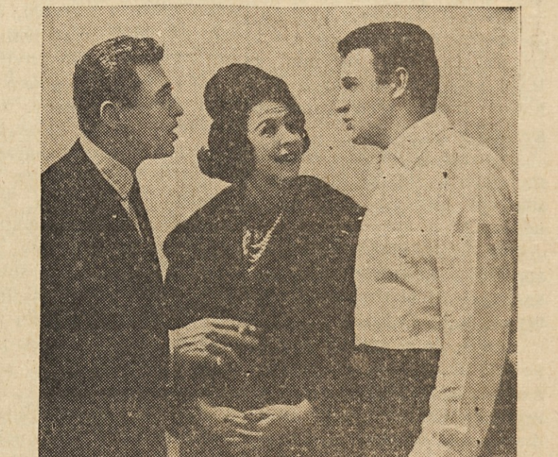
MED ODMOROM — Med dvema predstavama v newyorškem nočnem klubu pozdravlja Buddy Greco Steva Lawrence in Edia Gorme, ko ji čestita k uspehu.

Pogrebni zavod: 17002 Lake Shore Blvd. KENmore 1-6300 Pogrebni zavod: 1053 E. 62nd Street HENderson 1-2083 Trgovina s pohištvo: 15301 Waterloo Road KENmore 1-1235