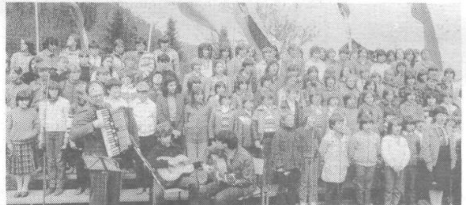
Pesem mladosti, svobode in vznesenosti prežeta z revolucionarnim izročilom je bila ob spremeljavi viške godbe na pihala in v izvedbi šolskih zborov iz OŠ Ljubo Šercer Ig in Oskar Kovačič izpeta udeležencem in prazniku v pozdrav.