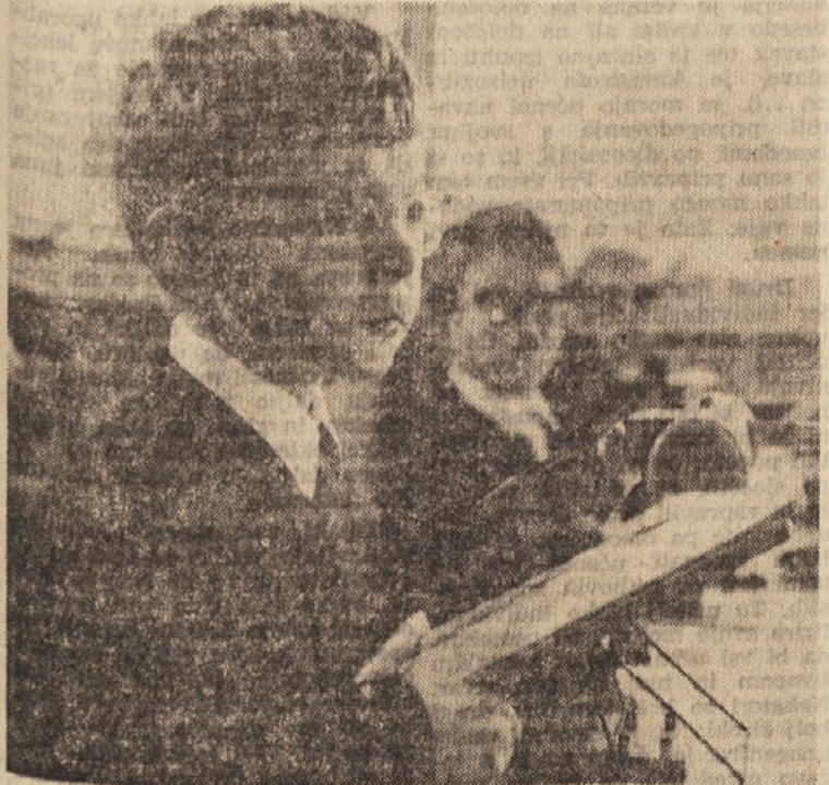
Slabovidni učenci so dobili posebne učbenike