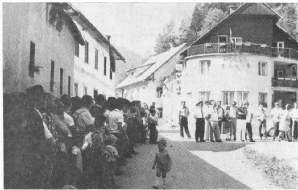
Gornjesavinjčani slavili pomembno delovno zmago. Cudovito Logarsko dolino so še bolj približali turistom. Odprli so 10 kilometrov asfaltirane ceste od Rogovilca do Solčave. Z novo urejeno cesto pa so tudi ljudje pridobili večje možnosti za življenje. V Solčavi je bila priložnostna svečanost, z njo pa so tudi občani moziške občine začeli praznovati letošnji občinski praznik. Praznovanje pa so končali prejšnjo soboto v Rečici ob Savinji. Več o občinskem prazniku poročamo na 8. strani.

21. september 1973 • Leto IX., št. 26 (196) • Cena 1 dinar • Poština plačana v gotovini