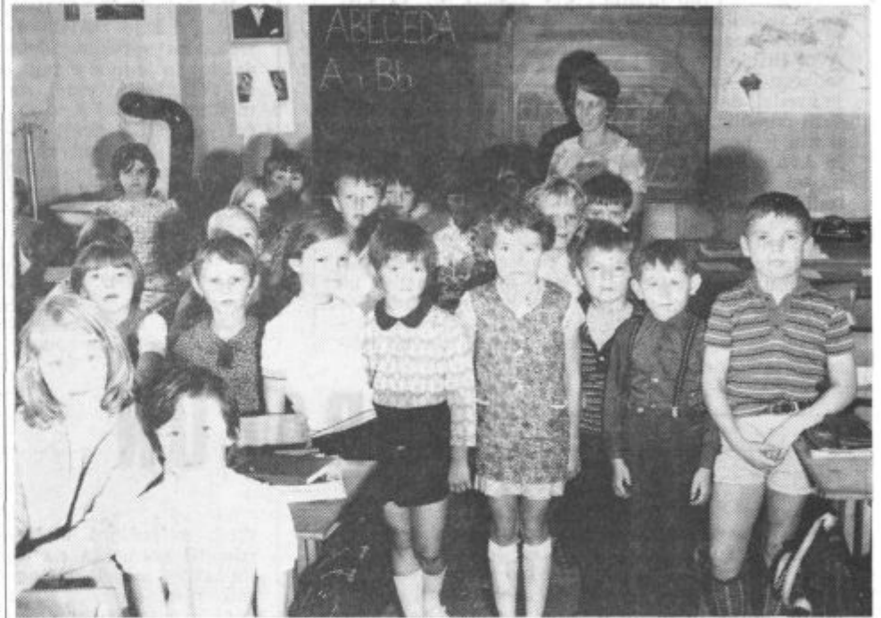
Ti učenci so se fotografirali še v prosvetnem domu, morda za slovo... V novih razredih ne bodo tako stisnjeni.

kanalizacijo v kraju, asfaltirali še 8 km cest, uredili javno razsvetljavo ter napolnili vodovod v gospodinjstva, ki ga še nimajo. »Vseh teh del ne bomo mogli sami rešiti v doglednem času brez ustrezne družbene pomoči. Ljudje tod nočejo zaostajati. Hočejo v korak z drugimi. Prepričan sem, da bodo podjetja v prihodnje še bolj pomagala pri urejevanju kraja, kjer živijo njihovi delavci. To je porok, da bomo svoj cilj dosegli in si