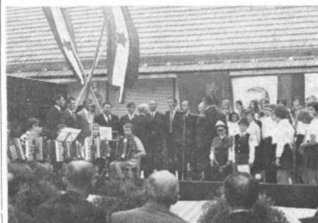
Kulturni spored so izvedli pevci, recitatorji in mladi harmonikarji.

da bi doraščajoči mladini dali možnost enakopravne vključitve v življenje. Za samoprispevek je glasovalo kar 79 odstotkov volivcev. Rezultat zavestne odpovedi Gornjesavinjčanov je tudi nova podružnična šola, ki so jo odprli prejšnjo soboto in pred katero je bila osrednja prireditve občinskega praznika. Solo so odprli mladi sami, zavedajoč se, da je to njihov hram, v katerem bodo dobili potrebno znanje za življenje.