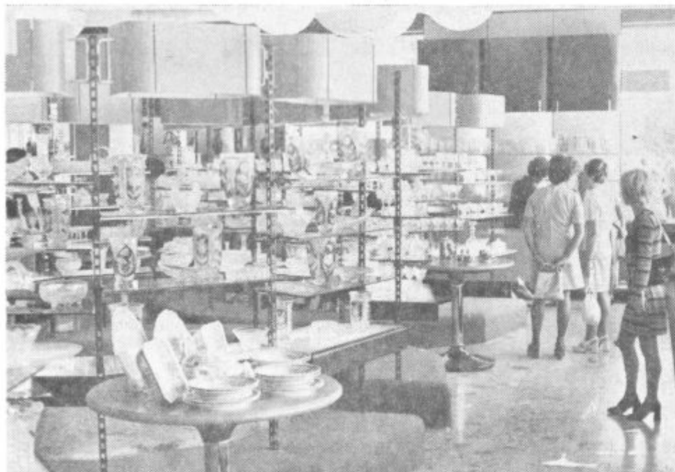
Notranost sodobne blagovnice Standard