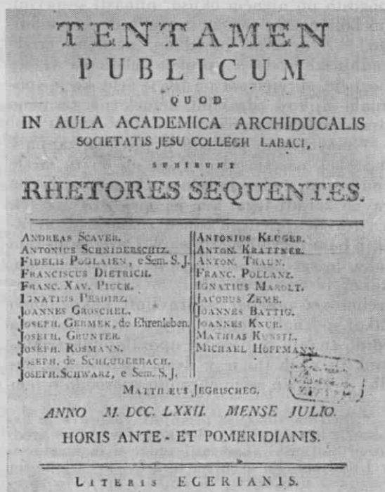
Naslovna stran tiskane teze za disputacijo z navedbo govornikov (Ljubljanski tisk, 1772)