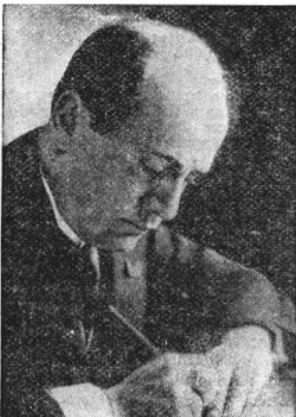
Šef italijanske vlade B. Mussolini je zadnje čase ponovno naglasil ozko povezanost Italije in Nemčije.