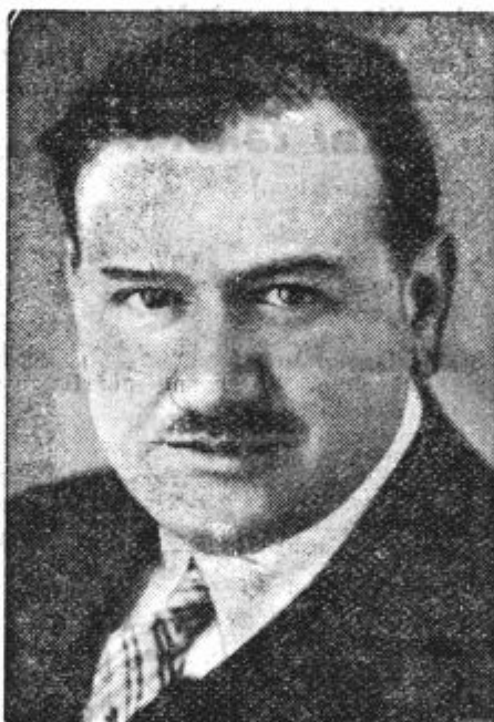
Francoski min. predsednik Daladier je nedavno v velikem govoru naglasil obrambno moč Francije in njeno stališče do italijanskih zahtev. Podčrtal je tudi miroljubnost Francije.

med Poljsko na eni strani ter Francijo in Anglijo na drugi strani že izdelan in da ga bo poljski zunanji minister podpisal v Londonu.