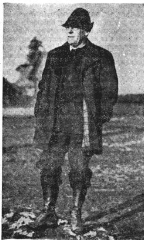
Dr. Vladko Maček, glavni politični predstavnik hrvatskega naroda pri pogajanjih za uresničenje srbsko-hrvatsko-slovenskega sporazuma, ki ga vsa naša, zlasti kmetijska javnost željno pričakuje.