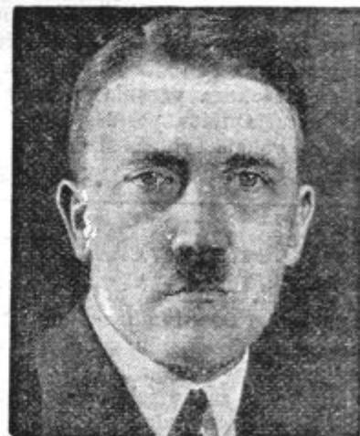
Nemški kaneclar Adolf Hitler. Okrog njegove osebe se danes suče nele vprašanje politike v srednji Evropi, ampak tudi vprašanje vojne in mira.

Kmetjski list najboljši prijatelj slovenskega kmetjskega človeka. Čitajte, priporočajte in širite ga povsod.