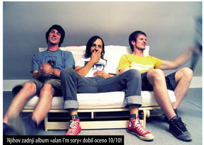
Njihov zadnji album »alan I'm sorry« dobil oceno 10/10!

Album »alan, I'm sorry« je naletel na izjemno pozitivne kritike. V spletnem glasbenem magazinu »Addicted to nothing« so dobili najboljšo možno oceno 10/10. Tukaj sem dodal recenzijo s te spletne strani, ki o rockovskem triu marsikaj pove. »Ob poslušanju plošče mi je jasno, da je band odlično glasbeno podkovan, pa vendar nikoli nimam občutka, da bi me ta ali oni komad spominjal na koga. /.../ Tako lahko z veseljem trdim, da za Nikki Louder pač ne velja tista znana krilatica "pa sej so dobri za Slovence". Rekel bi, da so v marsičemu boljši od večine balkanskih (srbskih) bandov, ki so v letu 2009 tako zrajcali vso slovensko alterna-