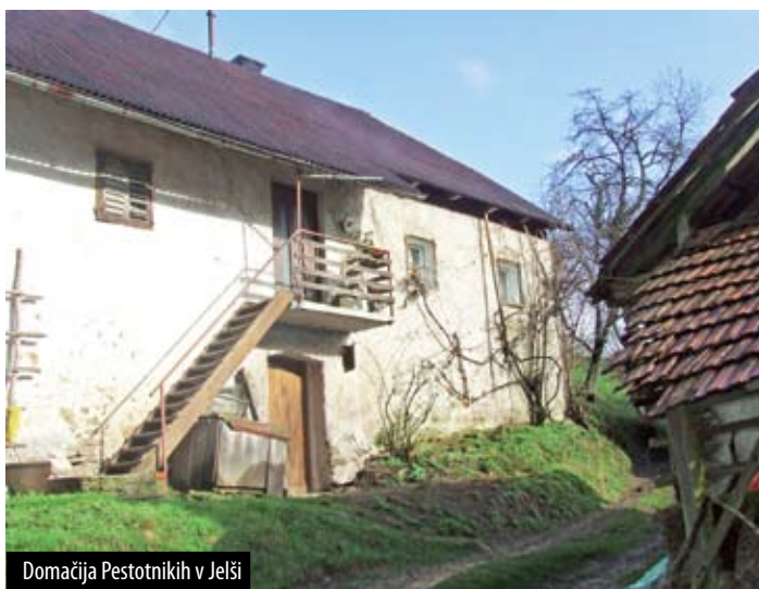
Domačija Pestotnikih v Jelši