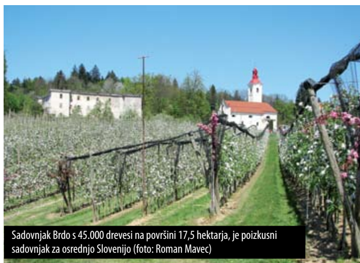
Sadovnjak Brdo s 45.000 drevesi na površini 17,5 hektarja, je poizkusni sadovnjak za osrednjo Slovenijo