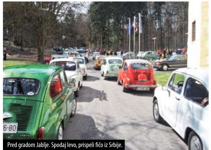
Pred gradom Jablje. Spodaj levo, prispeli fičo iz Srbije.

Ob 11. uri se je 105 lastnikov fičotov skupaj z obiskovalci