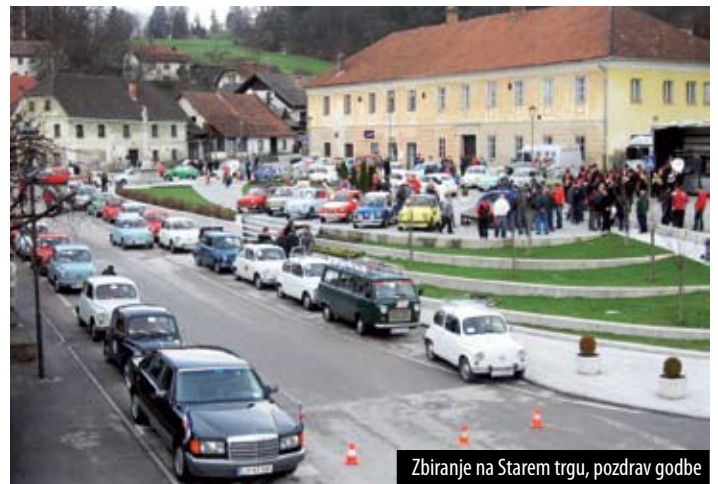
Zbiranje na Starem trgu, pozdrav godbe