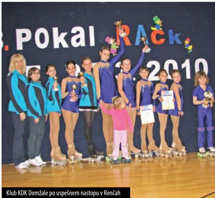
Klub KDK Domžale po uspešnem nastopu v Renčah

Seveda je potrebno pohvaliti prav vse udeležence te tekme. Kmalu bodo imeli nove priložnosti za dokazovanje, med drugim tudi na tekmah na RCU v Lukovici.