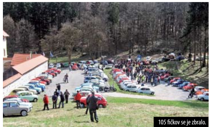
105 fičkov se je zbralo.