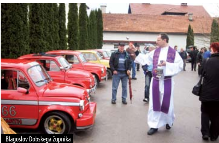
Blagoslov Dobskega župnika