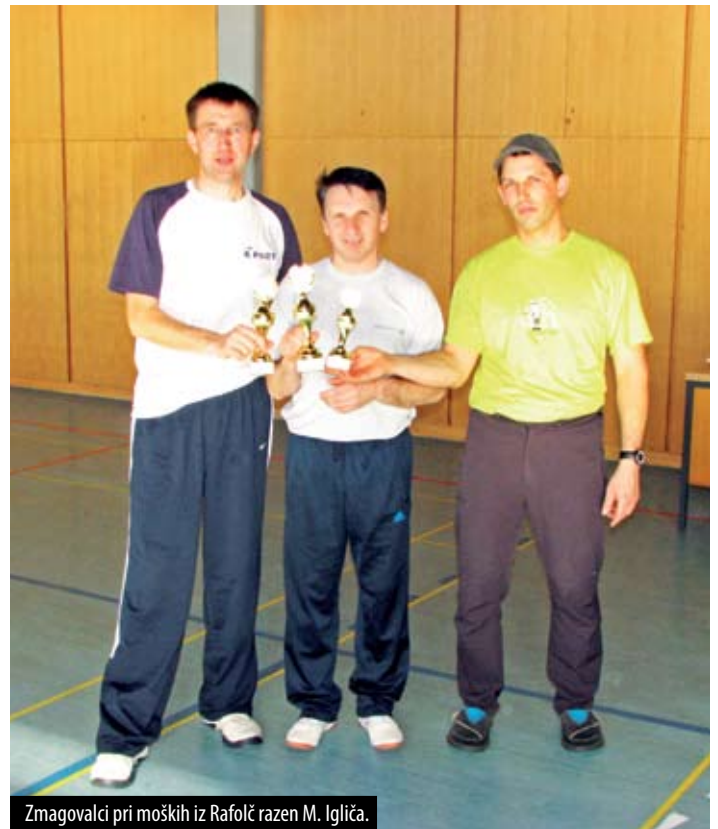
Zmagovalci pri moških iz Rafolče razen M. Igljiča.

Vsem sedanjim in še novim tekmovalcem želimo, da se za prihodnje leto še bolj kondicijsko pripravijo, da bodo še okretneje odbijali belo žogico.