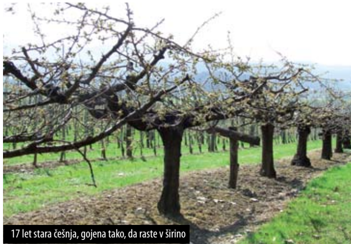
17 let stara češnja, gojena tako, da raste v širino

V sadovnjaku želimo imeti veliko življenja, imamo drogove, kjer posedata kanja in sova. Iščeta voluharje, in ko ga ujameta, naredita koristno delo. Ustvarjamo tudi ugodne naravne pogoje za življenje živali. Imamo podlasico, dihurja, lisico, osem mačkov in dva psa, vse v veliki meri zaradi boja proti voluharju. Imamo tudi bajer in ribnik; v ribniku imamo ribe, krape, ki so najboljši pokazatelj čistote vode, račke, nemo raco, mandarinke, to je tako imenovana ekološka niša, kjer se koncentriira več življenja; race, belouško, žabe, s tem popestrimo vse skupaj. Vseh teh živali se razveselijo tudi otroci, ki prihajajo k nam v sadovnjak, saj nas vsako leto obiše od 30 do 50 skupin. Otroci danes nimajo več prave predstave o naravi. Moje ljubljence so pa gosi, nimajo kakšne specialne funkcije, so pa izredno dobri čuvaji.