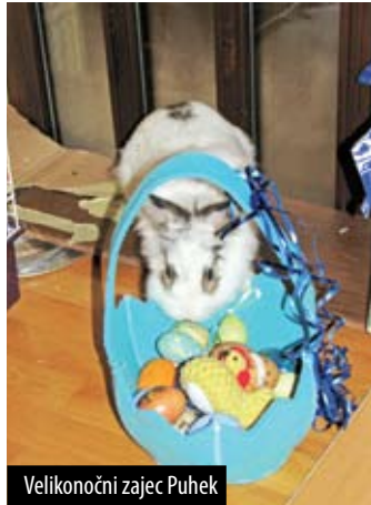
Velikonočni zajec Puhek

hekbunny« objavljenih še 15 kratkih filmov. V njih večinoma nastopa kunec Puhek, med drugim tudi v preskakovanju ovir in iskanju izhoda v snežnem labirintu. Drugi dve junakinji filmov sta ruski hrčici Peanut in Lola.