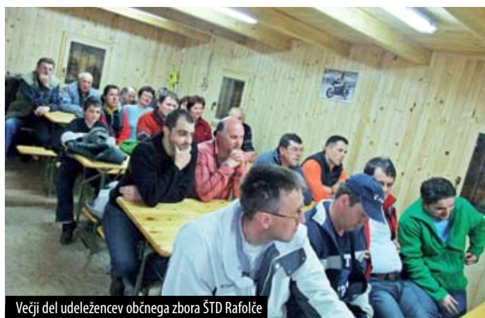
Večji del udeležencev občnega zbora ŠTD Rafolče

Ob skromni zakuski so se utrinjale še mnoge ideje, vaščani so se pogovarjali in spoznavali ter sklenili narediti ta konec občine še lepši.