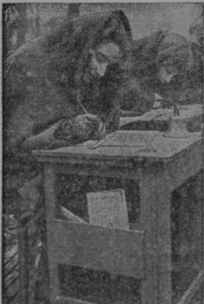
Šols pod milim nebom. V Londonu obstoja šola pod milim nebom ob vsakem letnem času.