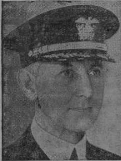
Admiral Claude Bloch bo prevzel z novim letom poveljstvo nad brodom Zdrženjih ameriških držav.

ste mrena. Štiri dni pred smrtjo je še bila v šoli. V Grižah je delovala devet let, rojena je bila na Verniki pri Ljubljani leta 1899. Pogreba se je udeležilo mnogo župljanov in obilo njenih stanovskih tovarišev in tovarišic. Vsi sočustvujemo s njenimi priletnimi starši, ki bivajo v Petrovčah in so sedaj izgubili zadnjega otroka, ki bi jim naj bil v njihovi starosti v podporo. Pokoj njeni blagi duši!