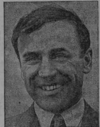
Jim Mollison, znan angleški letalec, hoče preleteti razdaljo Anglija—Avstralija v dveh dneh.