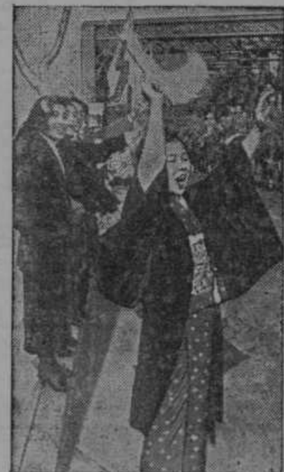
Japonke pozdravljajo z navdušenjem vojake pri odhodu na kitajsko bojišče.