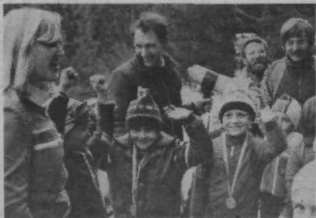
Kljub temu, da Slavnikovega avtobusa v Ljubljani ob dogovorjeni uri ni bilo na dogovorjeno mesto, da bi cilbani in njihove starše popeljal v Kranjsko goro (na pomoč so priskočili potem pri SAP-Viator) in so bili organizatorji v Kranjski gori zaskrbljeni, kaj bo s prvenstvom, se je potem vse dobro končalo. Malčki so se pokazali na smučeh kot pravi mojstri.